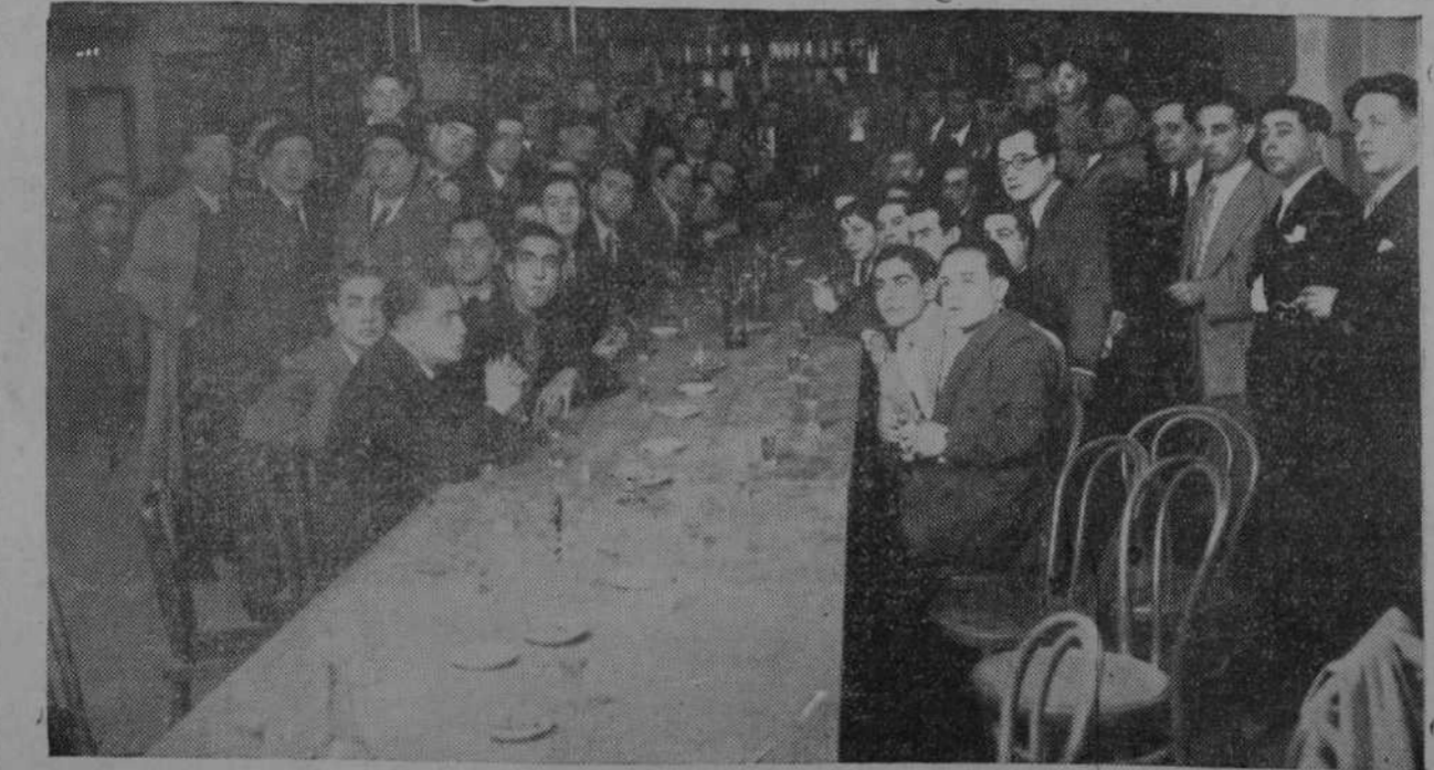
EL III ANIVERSARIO DE "LA GRAFICA".—El pasado domingo celebró varios actos "La Gráfica" y entre ellos un banquete al que asistieron todos los asociados. La "foto" recoge un detalle de la comida.

Aunque sobre el resultado de la citada diligencia se guarda la más impenetrable reserva por los facultativos que en ella intervinieron, no creemos aventurado participar a nuestros lectores que el obituario presentaba una herida en la región frontoparietal izquierda, como de un centímetro de extensión y de escasa pro-