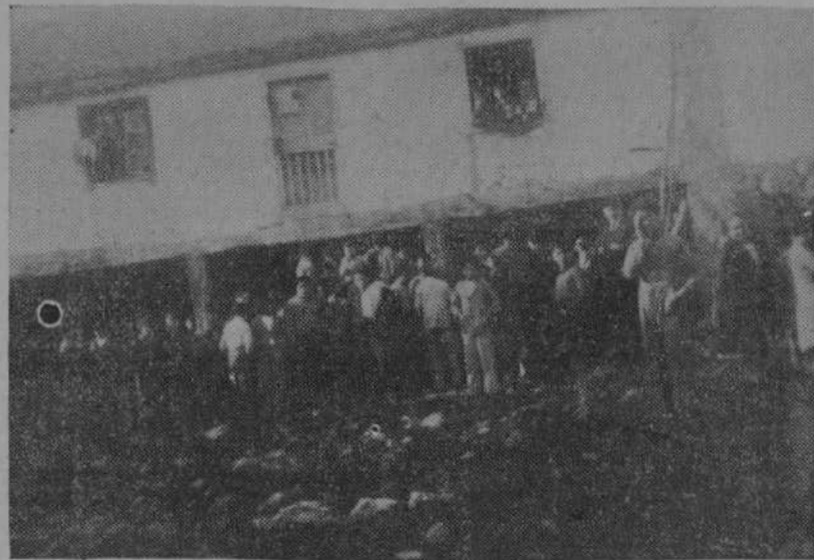
En las inmediaciones de la casa donde se cometió el crimen, grupos numerosos de vecinos hacen los sabidos comentarios.

Queda aprobado el pliego de condiciones que ha de regir en el concurso para la instalación de ascensor y montacargas en el nuevo edificio que se construye para la Di-