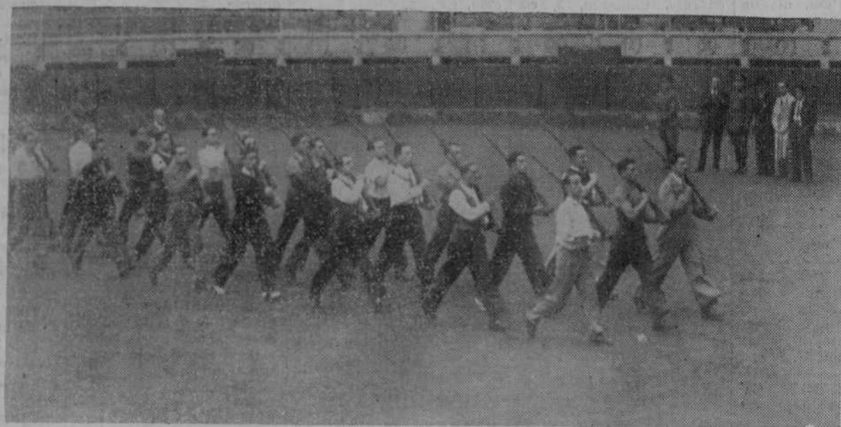
El coronel del regimiento de Valenciana, revistando a los alumnos de la Escuela de Instrucción pre militar del Tiro Nacional durante uno de los ejercicios que realizaron en la plaza de toros.

Por la insuficiencia del local, la entrada será por rigurosa invitación. Los asociados tendrán derecho a dos invitaciones, mientras los asistentes de que se dispone lo permitan, y podrán recogerlas previa presentación del último recibo, en el grupo escolar, hasta las seis de la tarde del sábado.