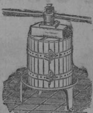
Prensas para uva y manzana desde 70 Ptas. Estrujadoras para uva. Mecanizadas para...

Roberto Bustamante Here- ña, Wad-Rás, 5, teléfono 16-06.