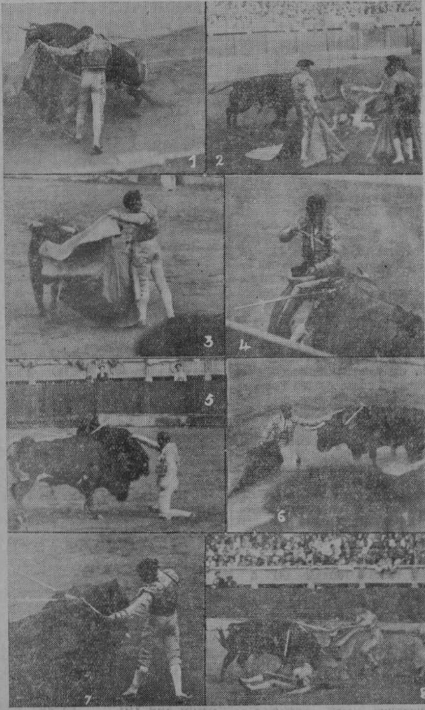
DE LA CORRIDA DEL DOMINGO.—1, Vicente Barrera lanzando a su primer toro.—2, Bienvenida, tozudillo él, no queda tranquilo hasta que consigue colgar la montera en un pitón como remate de un quite.—3, El sevillano parando los pies al primero de los suyos.—4, Garza entrando a matar.—5, Barrera en el único momento decoroso de su actuación.—6 y 7, Manolo cerca y Manolo despegado.—8, El sexto toro estuvo a punto de dar a Garza un disgusto de cuidado.