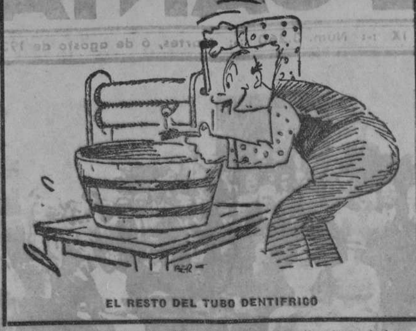
EL RESTO DEL TUBO DENTIFRICIO

clases, culpando al capitalismo de que el obrero tuviera que acudir a las filas socialistas, para encontrarse ahora sin Dios y sin pan. También considera responsable al liberalismo de que cierran las puertas de las fábricas, para abrirse las puertas del hambre.