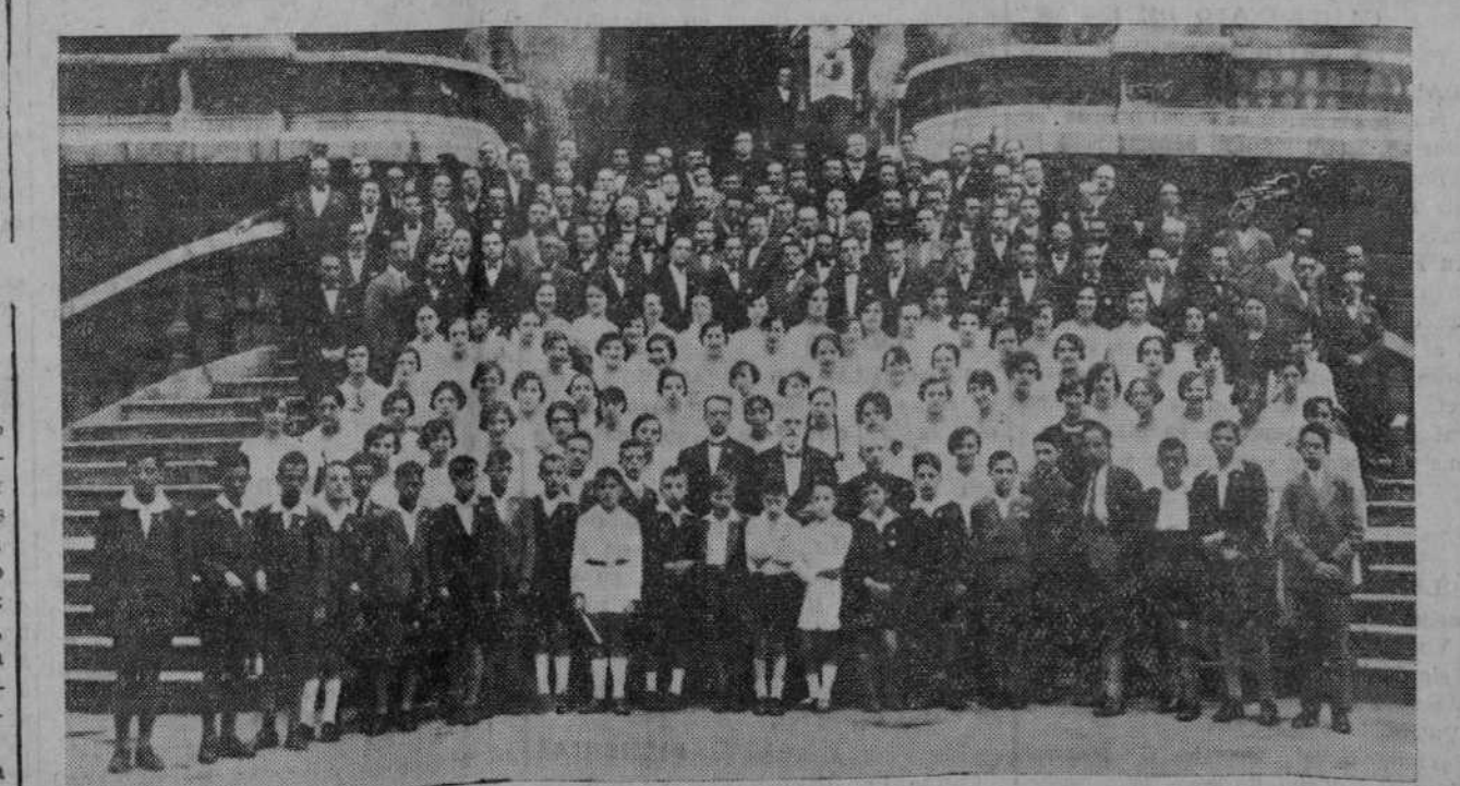
He aquí el laureado y famosísimo Orfeón Pamplonés, que actuará en el teatro al aire libre de la Feria de Muestra mañana, miércoles, y pasado mañana, jueves.