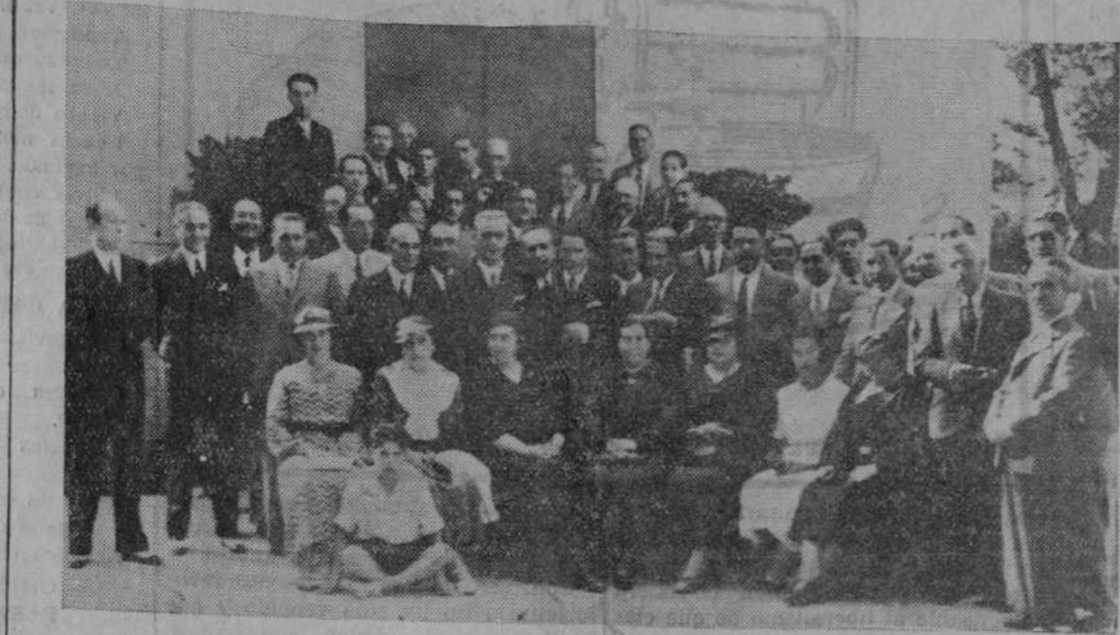
EL DOMINGO, EN LA FERIA DE MUESTRAS.—Grupo de autoridades y representaciones de León y Santander que asistieron al banquete oficial organizado por el «Fogor Leonés» con motivo de las brillantes fiestas típicas leonesas, celebradas el sábado y domingo en el teatro al aire libre.