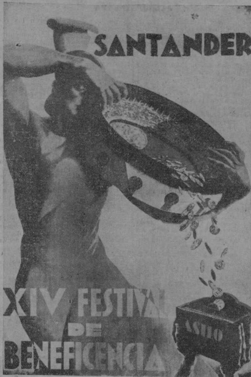
Preioso boceto, original de Eugenio Cortiguera, elegido por el Jurado encargado de fallar en el concurso abierto para elección del cartel de la XIV Bocerada de Beneficencia. El cartel reúne todas las perfecciones de composición, dibujo y colorido.

Especialista médico-quirúrgico de Estómago, Hígado e Intestinos. Alameda J. Monasterio, 4, 1.ª Consulta de 10 a 1 y de 4 a 5. Teléfono 23-81