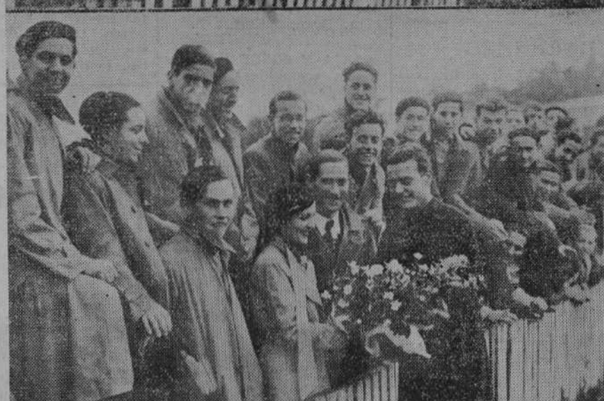
Ayer, en el campo del Eclipse, se celebró un partido de gran interés: nada menos que la final de la Copa S. E. U. El partido fué movido y atrayente, y he aquí cuatro de sus aspectos gráficos: Un grupo de «hinchas» del equipo de Comercio.—El «team» vencedor, Academia Juven.—La linda madrina del S. E. U. entregando los trofeos.—El notable «conce» de Comercio.