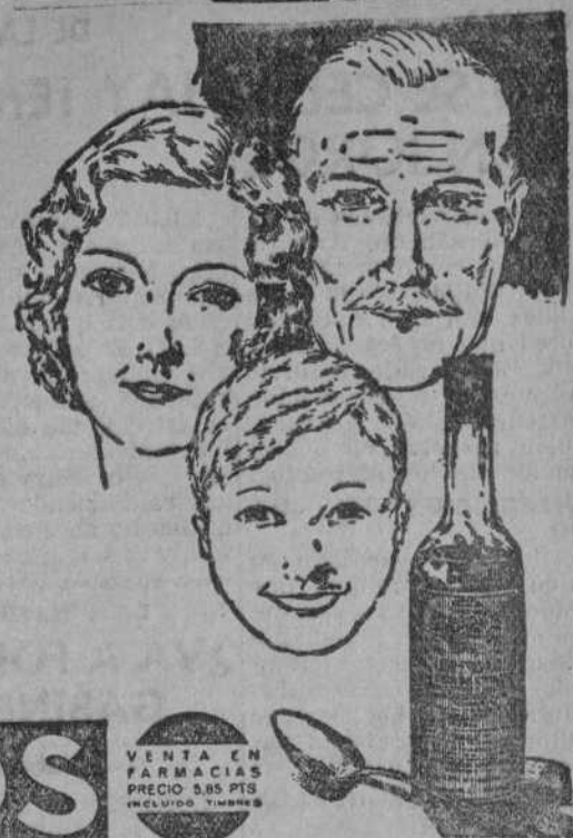
VENTA EN FARMACIAS PRECIO 500 Ptas