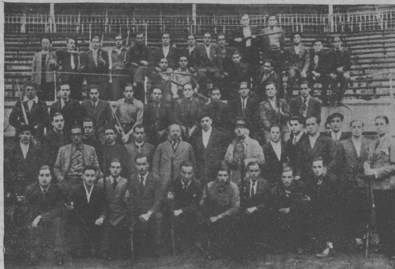
Grupo de reclutas, con sus profesores, que se incorporarán a filas y que han recibido la instrucción preliminar en la Escuela del Tiro Nacional de esta capital para reducir cuatro meses el tiempo de servicio en filas.