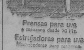
Prensas para una manzana desde 70 Ptas. Estringidoras para una machacadoras para manzanas.

INSTALACION motoras bobinaje: toda clase de reparaciones. D. Campoco- rdo. Llamad teléfono 19-08.