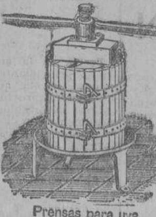
Presas para lina y manzana de 70 Fts. Estrujadoras para una Moledoras para nicotina

CUARTOS DE BAÑO, bañeras esmaltadas, lavabos bidet, termosifones, cocinas económicas. Presupuestos gratis. Casa Brazueta. Torrelavega.