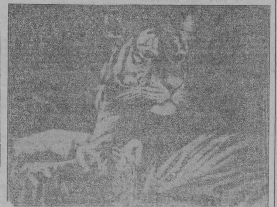
El tigre "Shangoo", del famoso grupo de 14 tigres reales de Bengala, que presentará dentro pocos días el conocido Circo Carl Hagenbeck.

Dentro de pocos días visitará Santander el Circo de fama mundial CARL HAGENBECK, para dar unas funciones durante pocos días.