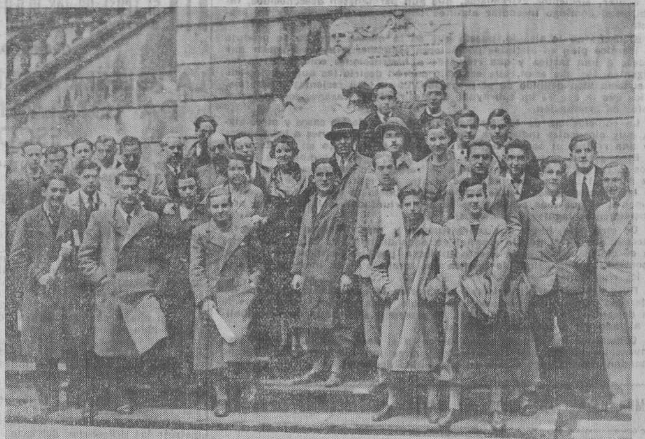
Profesores del Instituto de Torrelavega, con un grupo de alumnos, visitaron ayer diferentes Centros de Santander. La foto de Alejandro está obtenida en el momento en que los excursionistas salen de visitar la Biblioteca de Menéndez Pelayo.

—Oh, qué horribles instantes! Nosotros no podremos olvidarnos nunca de aquellos verdaderos dramas del mar que hemos presenciado tantas veces en el escenario de aquella hirviente espuma, entre silbidos del huracán y el hórrido fragor del trueno y de la rompiente, embarrada, de aquellos dramas del mar trazados con hechos reales e imborrables recuerdos de sañe y desolación que han llenado de angustia nuestros corazones, de lágrimas inarrobables nuestros espantados ojos y de luto y de dolor imperecedero honores y nublados enteros de aquel bello litoral de la costa cántabra. Momentos terribles en los que nuestras almas unidas por un sentimiento de piedad y de conmiseración e identificadas con las de aquellas tristes familias, elevábamos al cielo, juntos, una oración llena de religioso interés, de apasionado amor, porque librara el Señor a tantos nobres seres de la muerte, del luto, de la desesperación y del esparto... Momentos en que, no obstante ser relativamente breves nos parecían inacabables por la imponente realidad que los presidía. Momentos, en fin, de verdadera angustia, de dolorosa prueba que, de persistir, habrían de terminar en estado de muerte, en cardial y forzosa consecuencia para cuantos presenciá-