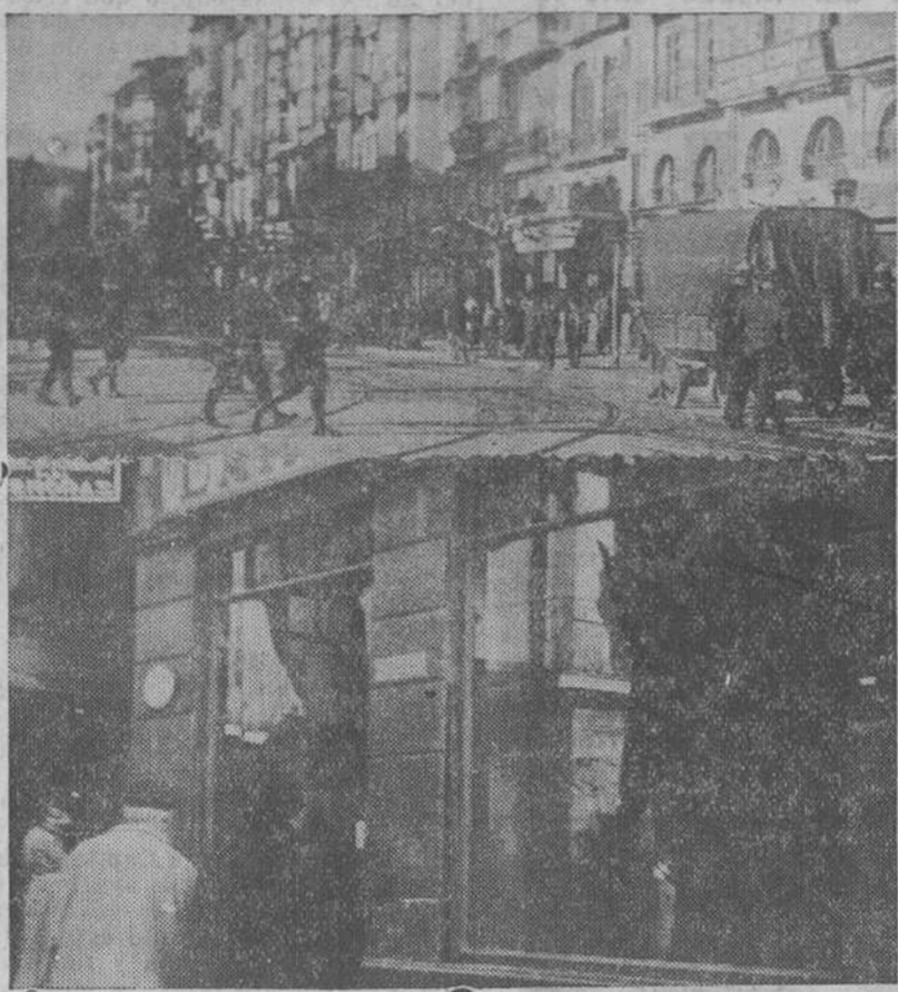
Dois notas como resumen gráfico de la jornada. Los guardias de asalto en constante vigilancia en las calles y una de las lunas rotas por los grupos de mozalbetes.