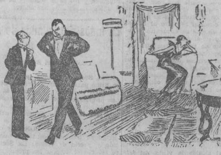
—¡Caramba! ¿Otra disputa con su mujer? —No, señor. Es la misma que usted presencié cuando estuvo aquí el mes pasado.