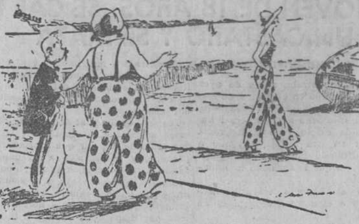
—Mira, Celedonio, un traje de baño como el mío. ¡A ver si luego te vas detrás de ella creyendo que soy yo!...