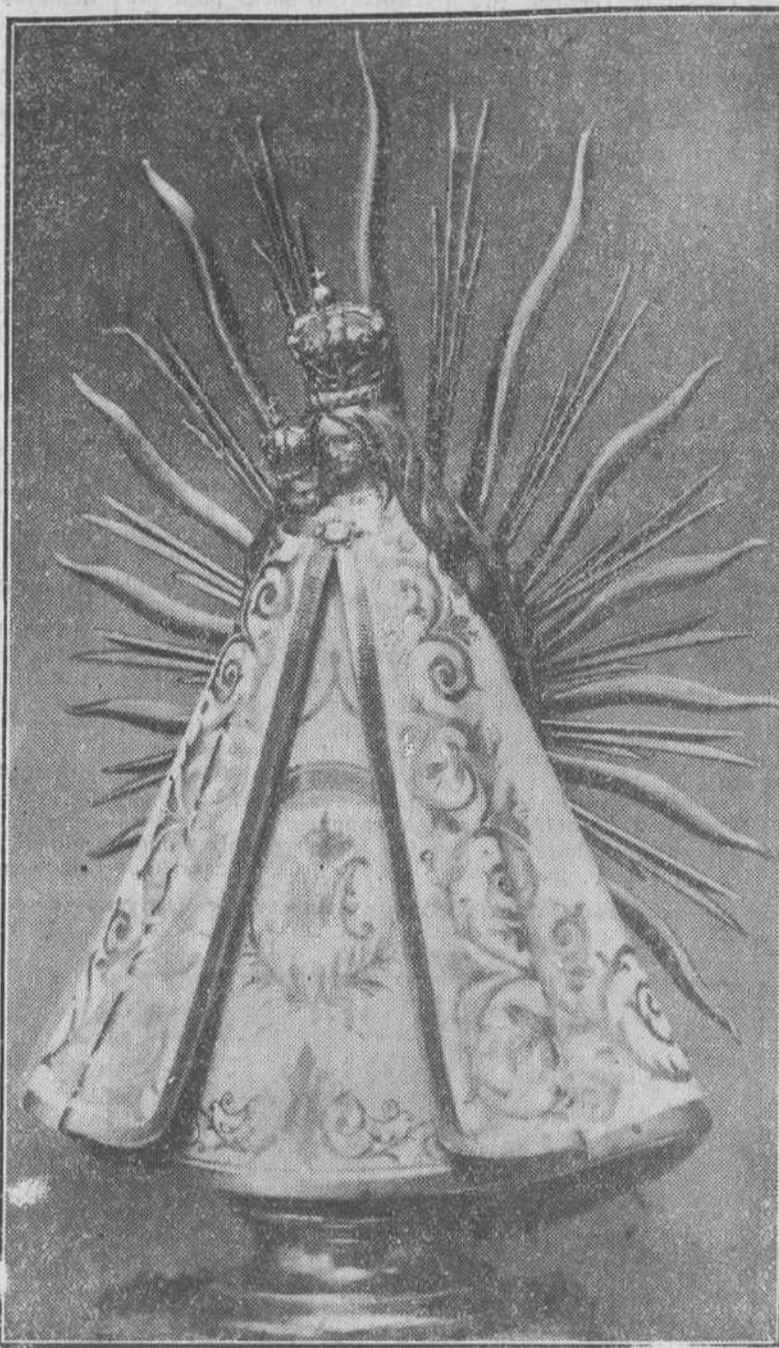
Nuestra Señora Bien-Aparecida, patrona de la diócesis y provincia de Santander, cuya fiesta se celebra hoy en el mismo lugar en que se apareció (Hoz de Marrón). Esta imagen que publicamos se venera en la parroquia de La Anunciación (Compañía) y fué bendecida por el señor obispo e inaugurada solemnemente el año pasado.