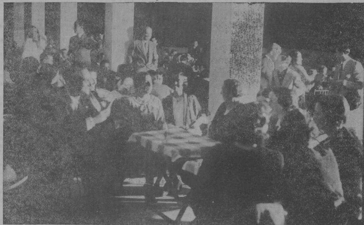
En Ampuero se ha celebrado una verbena. Fiesta brillante y grata, que ha constituido un señalado acontecimiento en la vida de sociedad. La presente foto de Leoncio recoge el aspecto de un animado rincón del local donde se celebró la fiesta.