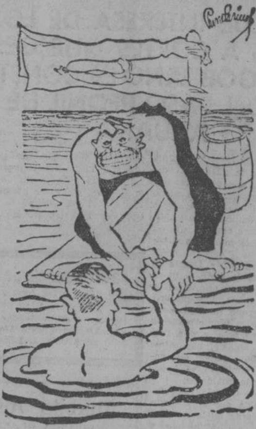
—¡Gracias, gracias! Usted me ha salvado la vida. —Es natural; hace ocho días que no he comido.