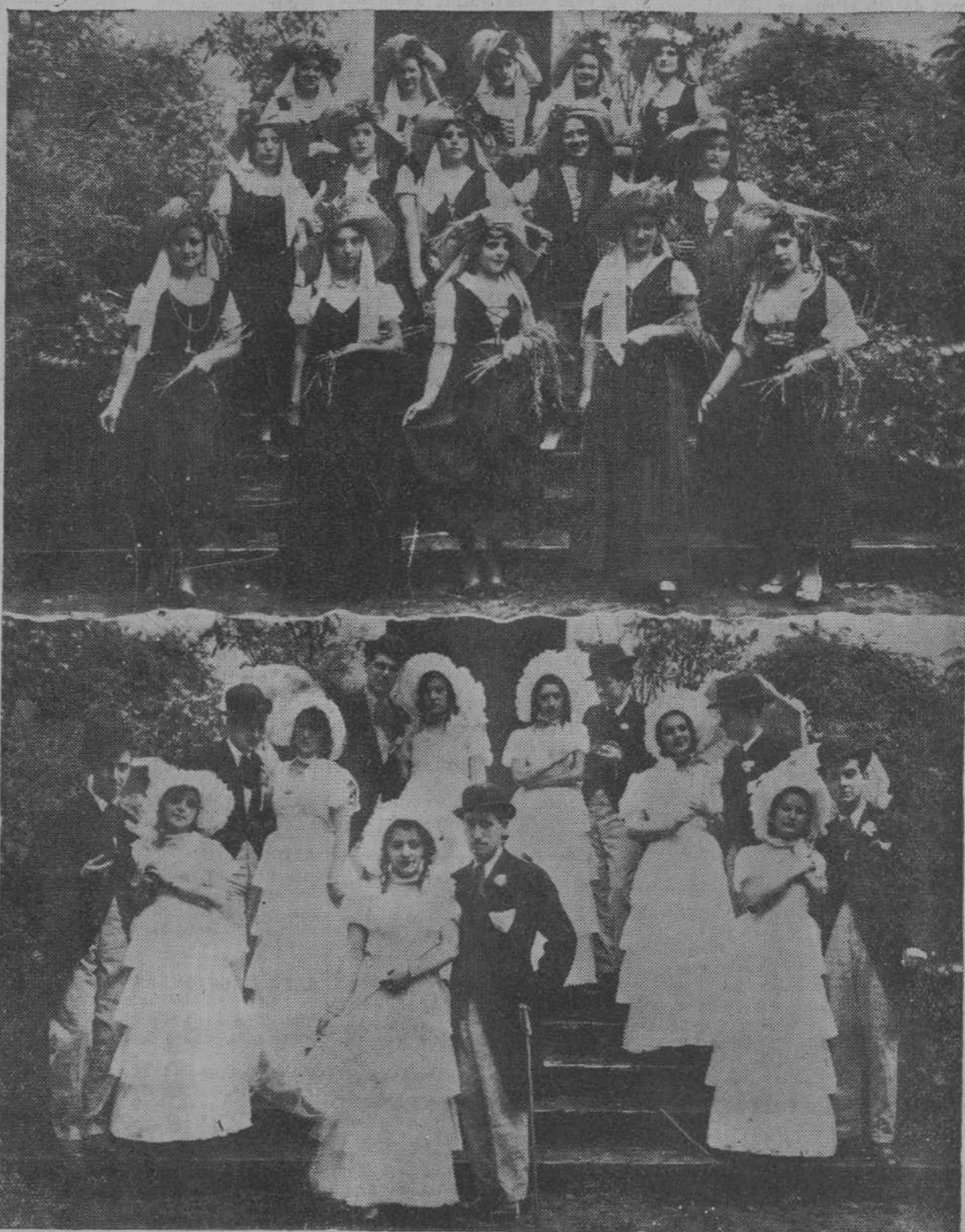
El sábado pasado se celebró en el Casino Lince de Santoña una brillante función teatral. Momentos felices de ella son los que recoge el presente grabado: bellísimas señoritas y díscolos muchachos que interpretaron notablemente los roles de «Las espigadoras», de «La Rosa del Azahar» y «Las sombrillas», de «Luisa Fernanda», escuchando grandes ovaciones.