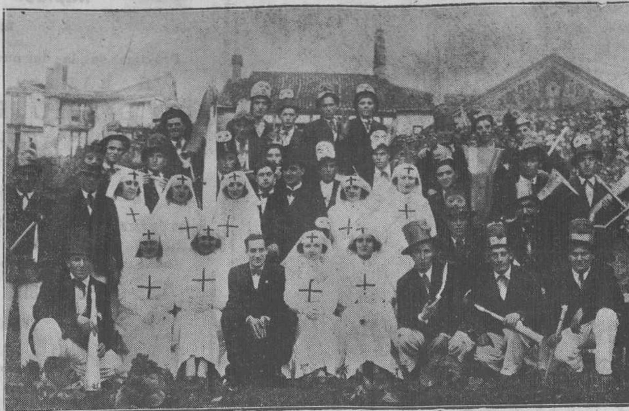
Sana y bendita alegría las de estas lindas señoritas y estos simpáticos muchachos de Laredo. Su excelente optimismo les llevó a formar esta alegre comarsa en que los recoge la "foto" y a recorrer los pueblos comarcianos en postulación para mejorar los servicios del Hospital del Espíritu Santo de la villa. Semejante proyecto tenía que contar con el apoyo de la opinión pública, y la notable comarsa ha recaudado sumas importantes.