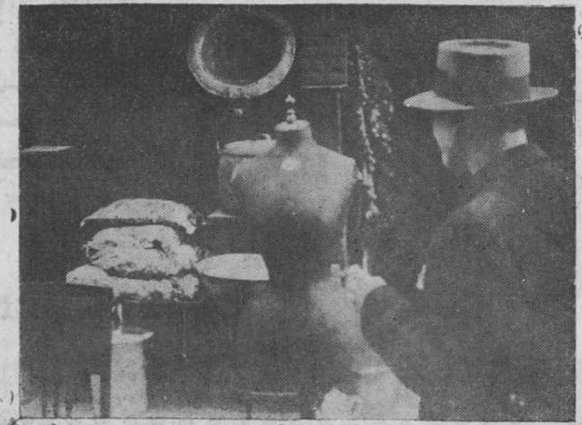
Una maniquí que ha conocido tiempos mejores, hace a «Cay» sus confidencias.

Los señores Rodríguez Prieto han sabido una vez más dar el tono de modernidad y de distinción, practicando una innovación comercial que quita el mal sabor del pesimismo de la época, por lo que les felicitamos muy sinceramente.