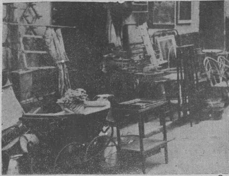
Ante las puertas de las prenderías los más diversos objetos se ofrecen, sugerentes, a los futuros compradores.

Ante la viva tonalidad y revuelta confusión de mil objetos diversos que, como despojos inanimados del naufragio de muchas vidas, llegaron al quieto refugio de la trapería en un flujo y reflujo constante, nos hemos detenido en una soleada tarde de este ahora febrero lluvioso y gripal.