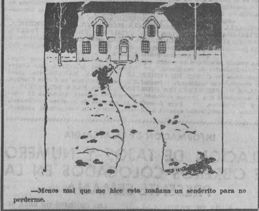
—Menos mal que me hice esta mañana un senderito para no perderme.