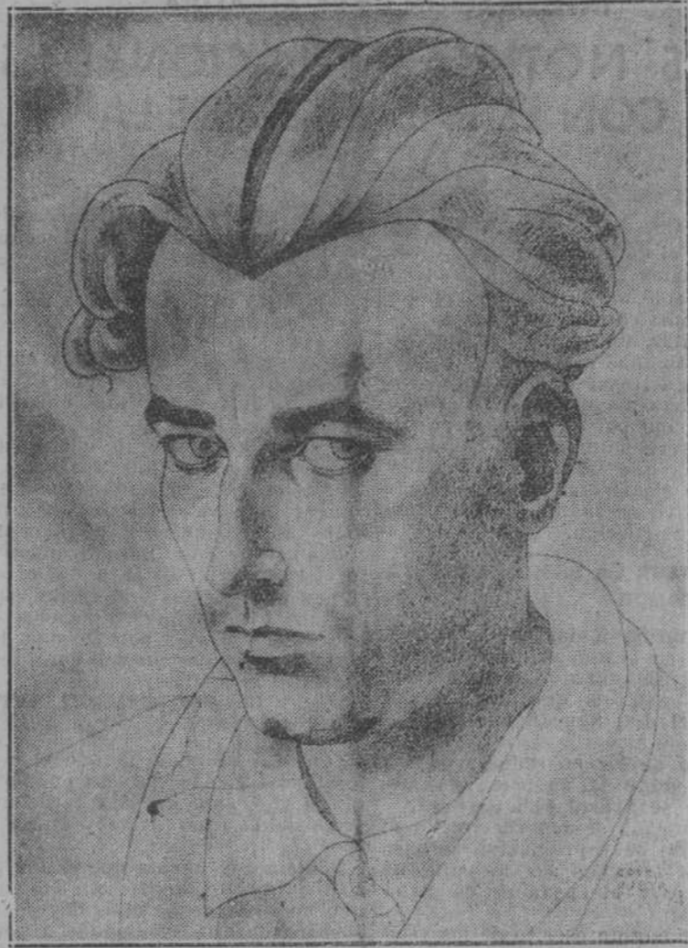
Autoretrato que figura en la Exposición.

En uno de los salones del Ateneo de Santander se ha inaugurado, el día 17, la notable Exposición de cuadros debidos al mágico lápiz del joven artista montañés don Eugenio Cortiguera.