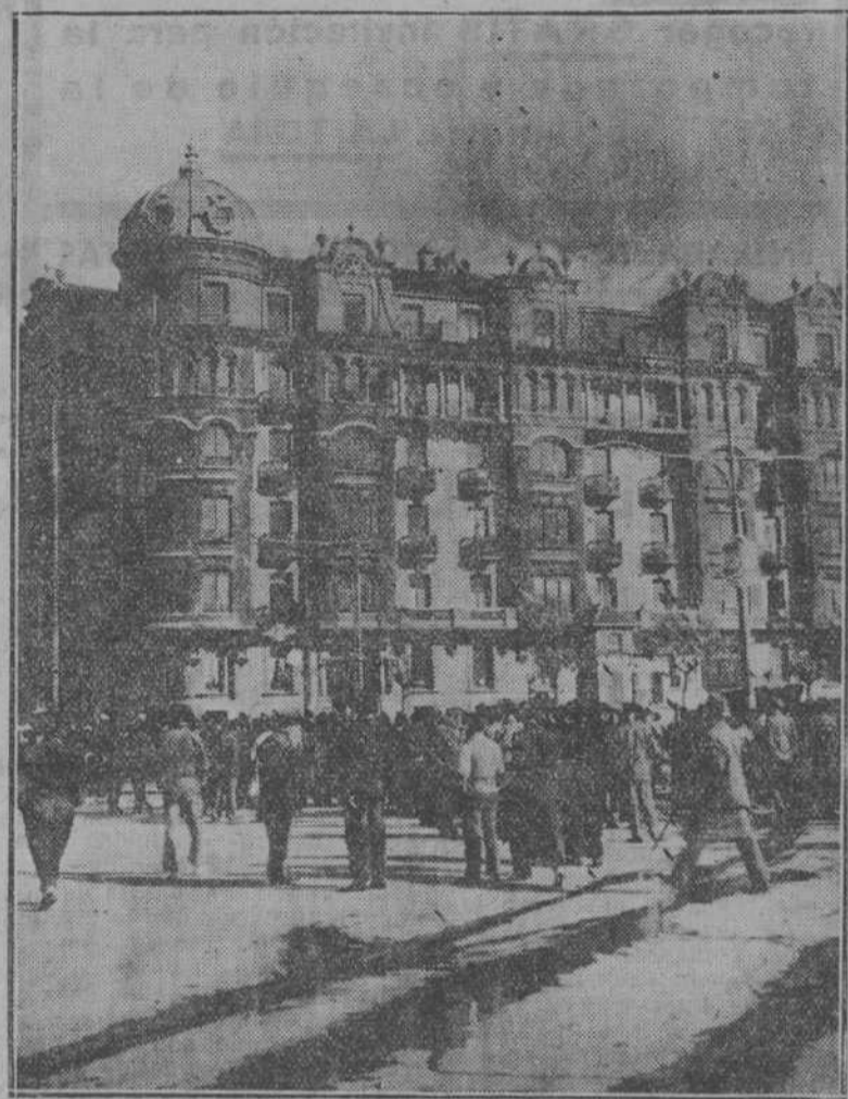
En la mañana de ayer produjo alarma en la ciudad la noticia de que se había declarado un importante incendio en la casa llamada de Gándara. La pericia y arrojo de nuestros bomberos vencieron rápidamente el incendio, no obstante la violencia con que a aquella hora soplaban el Sur. La foto está tomada en el momento en que el siniestro se presentaba más amenazador.