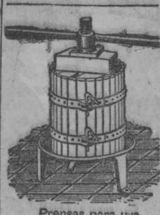
Prensas para uva y manzana desde 70 Ptas. Estrujadoras para uva. Machacadoras para manzana.