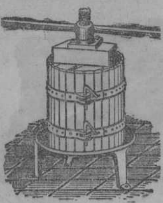
Presas para uva y manzana desde 70 Ft. Estrujadoras para uva. Machacadoras para mermeladas.

ACADEMIA MERCANTIL. Primero de Layo, 18, segundo. Contabilidad, prácticas, cálculos. Oposiciones de todas clases. Taquímeografía. Inglés, francés. Clases especiales para señoras. Procedimientos modernos, rápidos y eficacísimos.