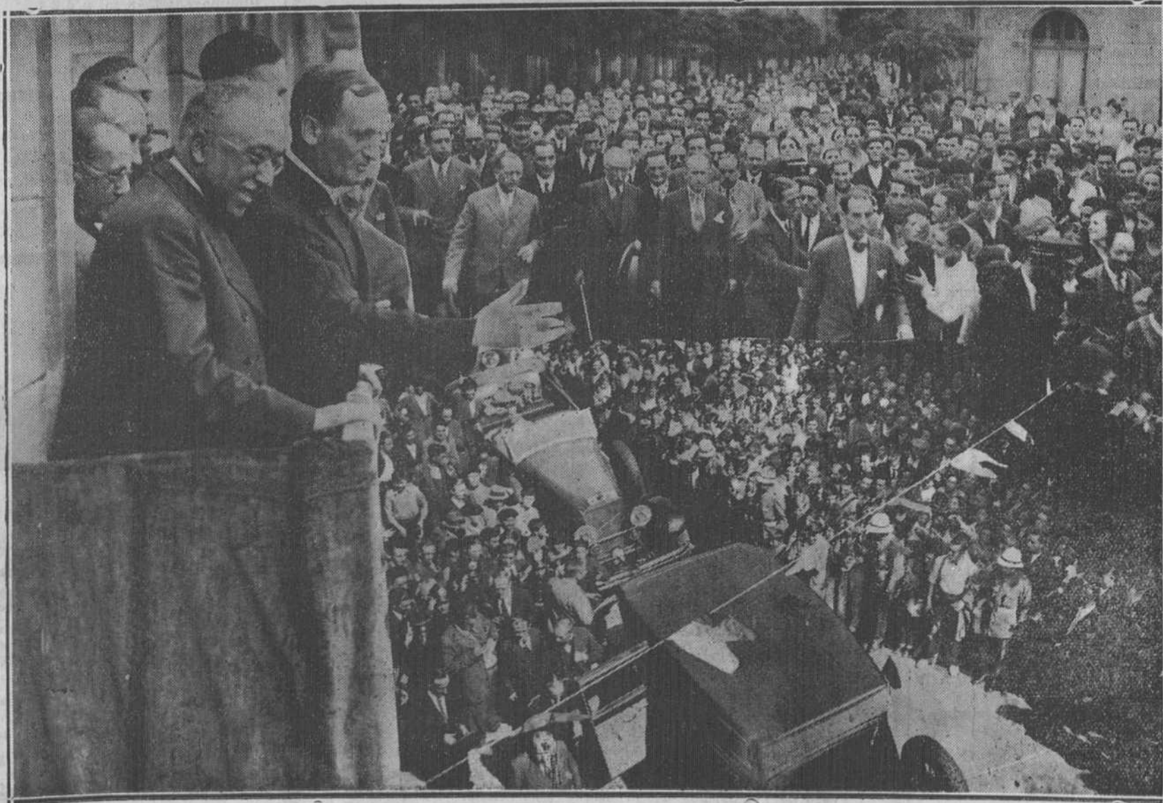
EL PRESIDENTE DE LA REPUBLICA, EN TORRELAVEGA.—El señor Alcalá Zamora, seguido por la multitud, pasea por la ciudad.—Llegada del Presidente al Ayuntamiento.—El Jefe del Estado y el alcalde en el balcón del Palacio municipal.