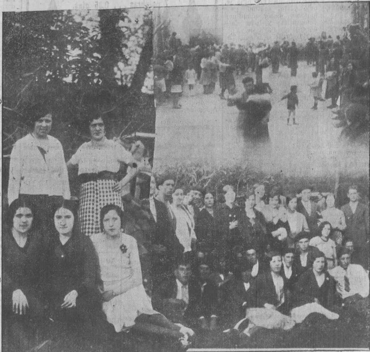
El buen tiempo añade al encanto del paisaje montaños las notas de color y animación de sus típicas romerías. Mayo empieza ya a dar los frutos de esta alegre cosecha. El grabado recoge tres momentos—el comienzo del baile en la típica bolera de Maza y dos grupos de bellísimas romerías y divertidos romeros—de la fiesta de la Cruz en Castañeda. Fiesta magnífica que hoy hallará una nueva expresión en el delicioso pueblo montaños.