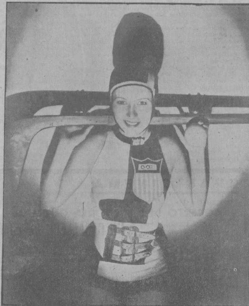
FIGURAS DE LA PANTALLA.—¿A que no saben las naciones civilizadas para qué se ha puesto tan fresquita la linda «estrella» de la Metro-Goldwyn, Karen Morley? Pues para jugar al «hockey». Nada más. No extrañe que los cronistas del juego digan como resumen: Todos, bien; pero Karen Morley fué la que «lució» más.

A los periódicos y revistas de España y principalmente de América que reproducen los artículos de : : LA VOZ DE CANTABRIA : : expresamos nuestra gratitud por el honor que nos dispensan, pero les rogamos que hagan constar al plebiscito de esos trabajos, todos los cuales son de nuestra exclusiva.