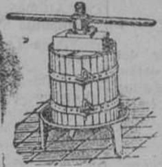
Prensas para uva y manzana desde 70 Ptas Estrujadoras para uva Machacadoras para manzana pedir catálogo a MATTHS GRUBER MILBAO, Alam. S. Mames 74 el 53

SE ALQUILA piso, sol todo el día. Cuarto de baño. Informarán, Avenida de Alonso Gullón, 26. Tenería Aguerre.