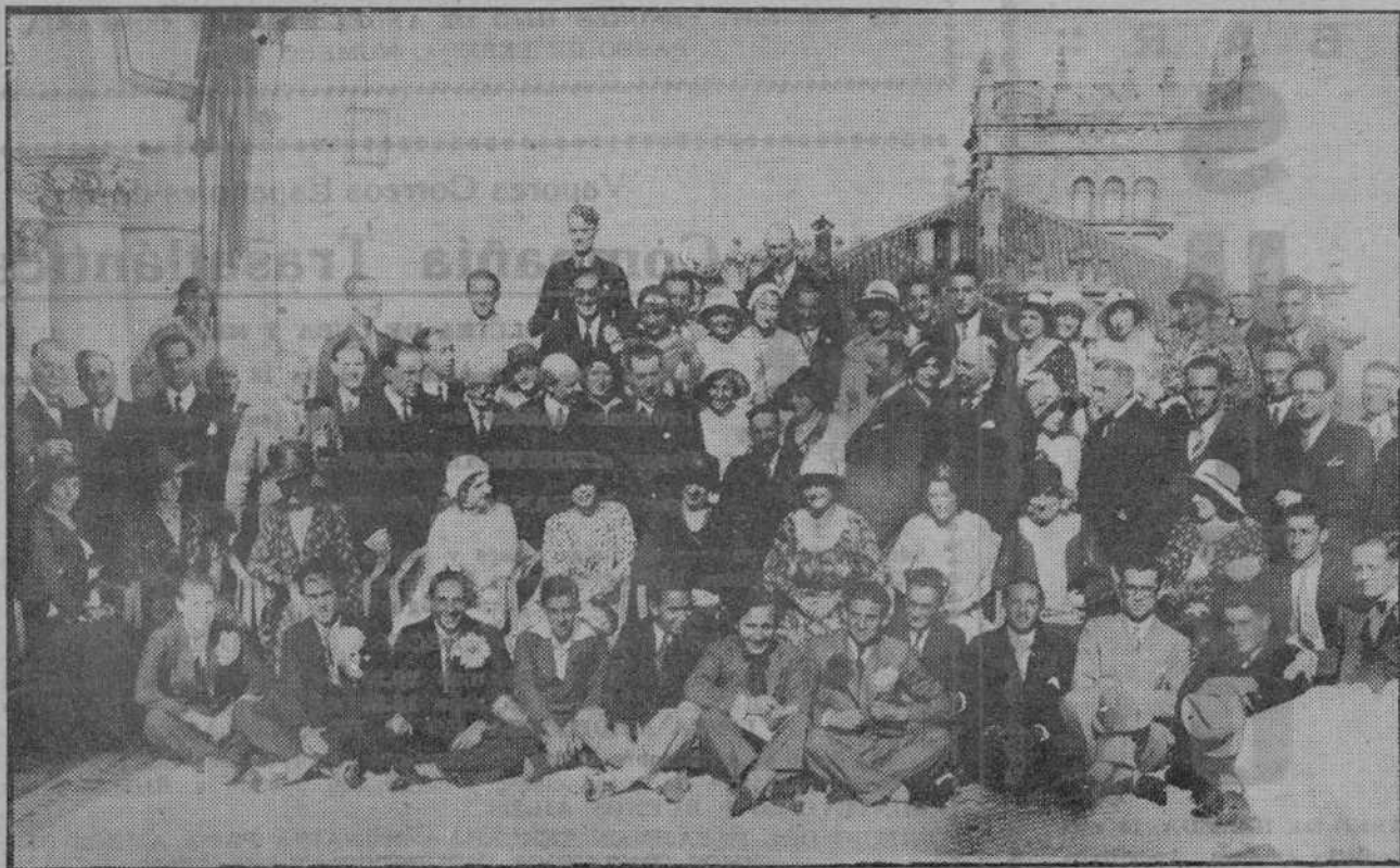
Grupo de asistentes al banquete celebrado en el Hotel Real en honor de las personalidades francesas llegadas con ocasión de las fiestas de confraternidad que se celebran estos días.

Arte, belleza, distinción serán los dos conciertos de la CORAL FILARMÓNICA VALENTINA en el GRAN CINEMA, el lunes 17.