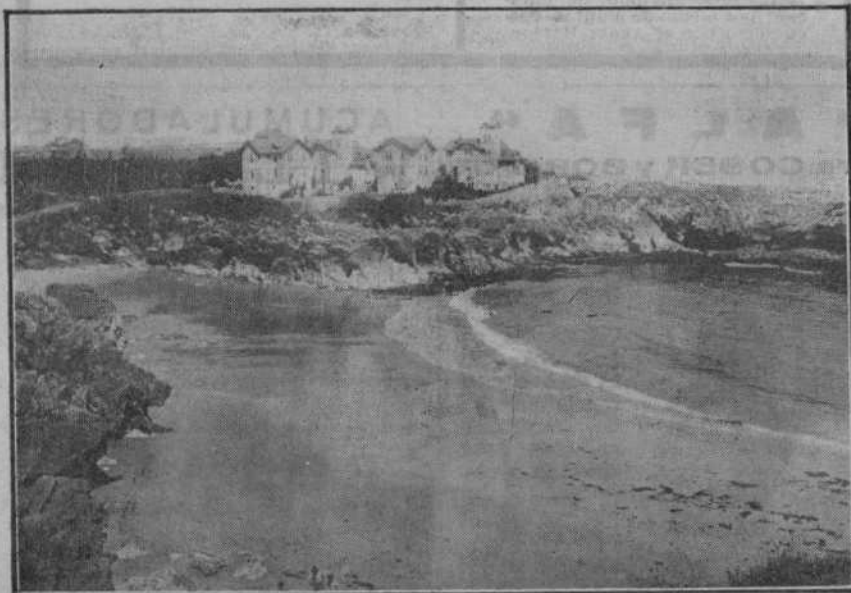
La magnífica playa llanisca de Puerto Chico, prodigiosamente dotada de encantos naturales, que es como una belleza escondida del litoral Cantábrico.