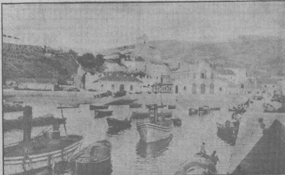
El puerto de Laredo al subir la marea.

En medio de este confundirse de los lamentos y de este baladro agudo de energía, la sensación optimista de una ventura que ya asoma por el camino. Los ojos de todos los espíritus se po-