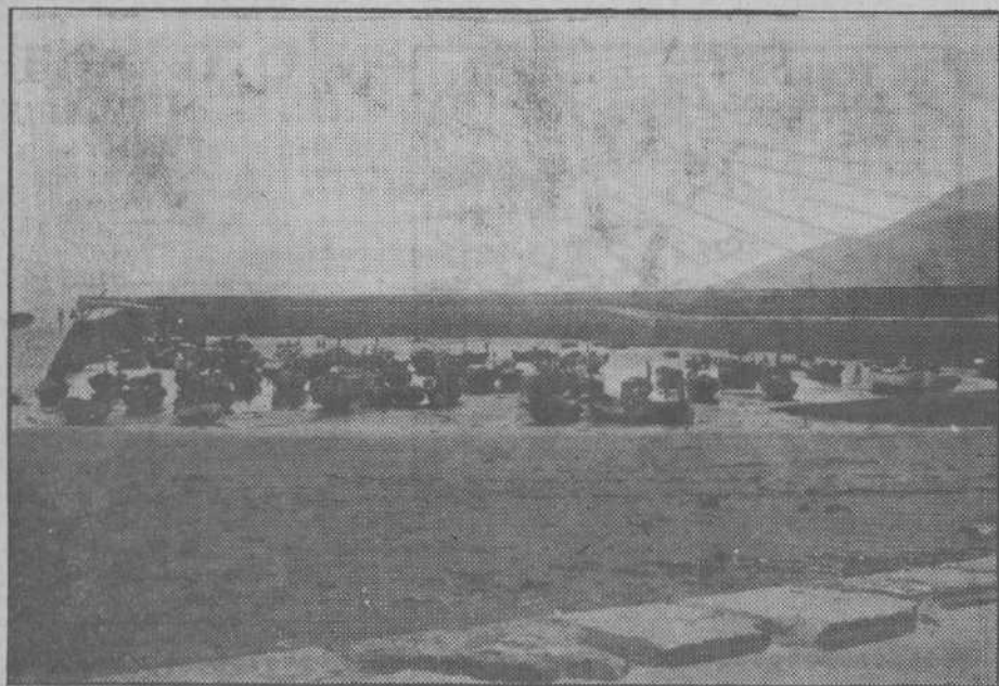
Los barcos tumbados en la arena entre el cerco pardo, claro, ceniciento de estos muelles de piedra...

garmada a los peñascos, a los muñones de las encinas, a la cabellera abundante y verde de las brañas.