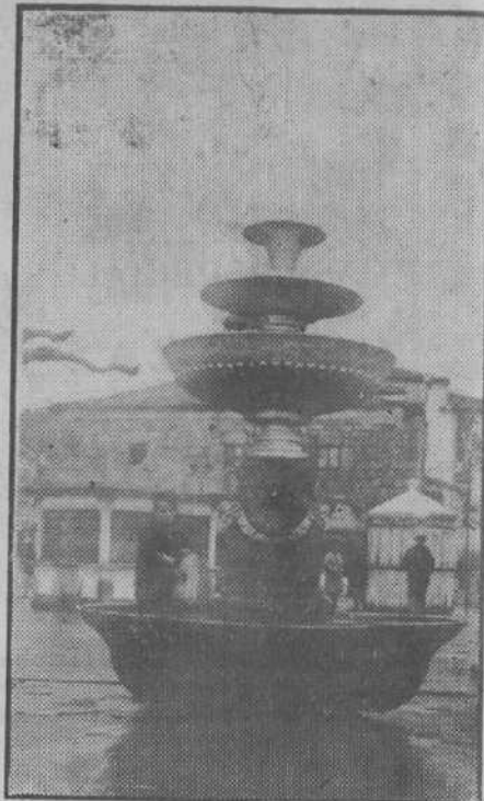
Donde rumorean estas aguas cristalinas y delgadas se irguió la torre de una casta de cachupines...