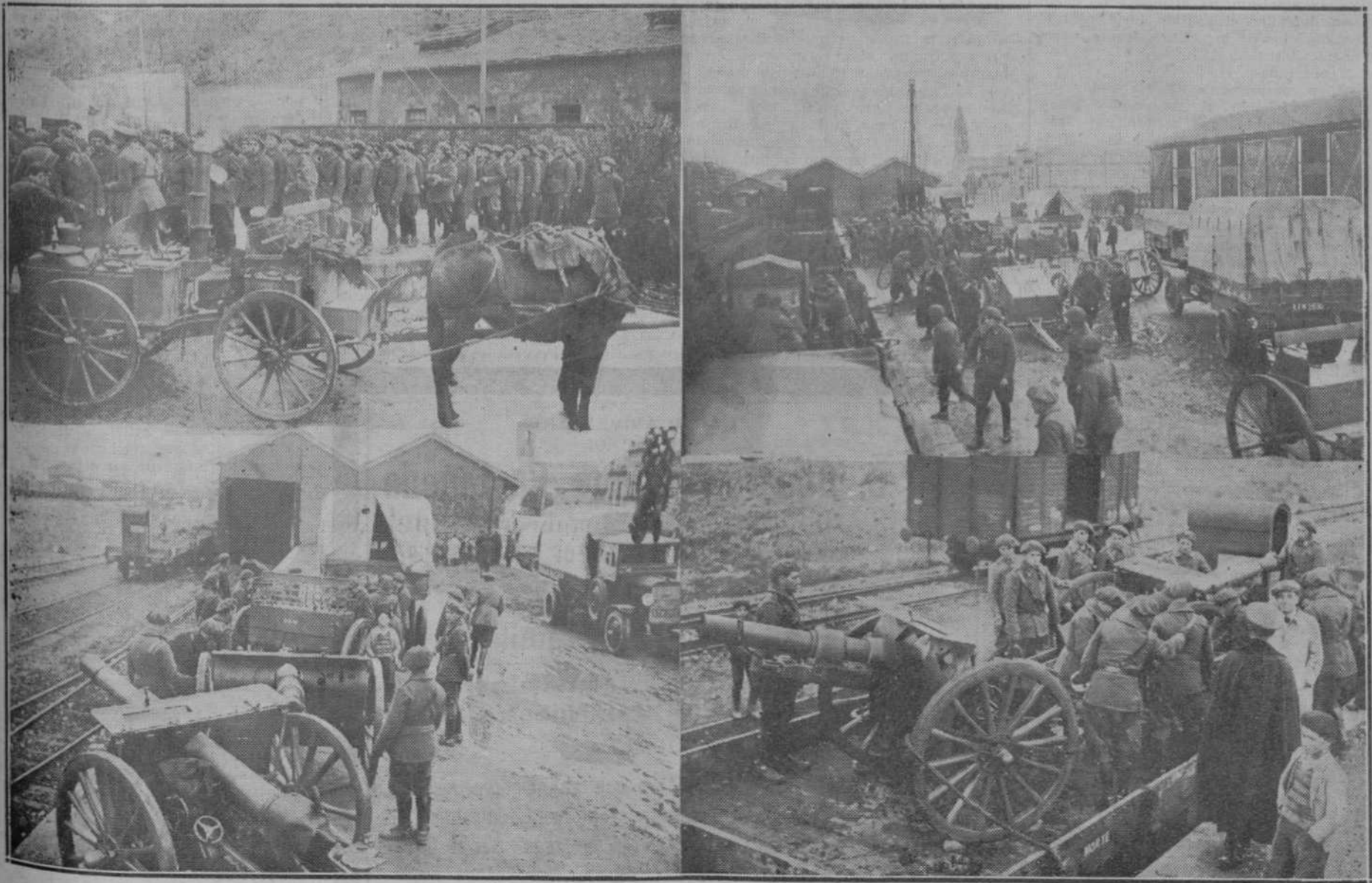
LLEGADA DEL REGIMIENTO DE ARTILLERIA, DESTINADO A SANTOÑA.—En la mañana de ayer llegó a la estación del Norte un tren especial conduciendo al regimiento de Artillería que ha sido destinado a Santoña.—Poco después de la llegada, a los soldados se les sirvió el desayuno.—Aspecto del muelle durante el desembarco del material.—Las piezas son remolcadas por camiones.—Desembarco de dos piezas.

Esta profunda división de la ilustre familia, no es más que un esquema de la división actual de nuestro pueblo. Sin ninguna mira partidista y sin querer sacar de los hechos ninguna consecuencia