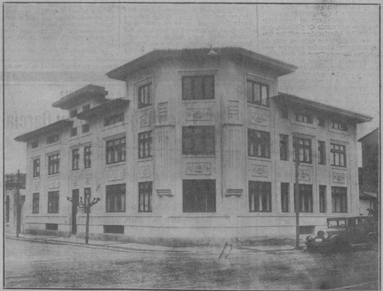
MEJORAS LOCALES.—El magnífico edificio, que será inaugurado próximamente y en el que quedarán instalados el Instituto Provincial de Higiene y otros servicios sanitarios oficiales.