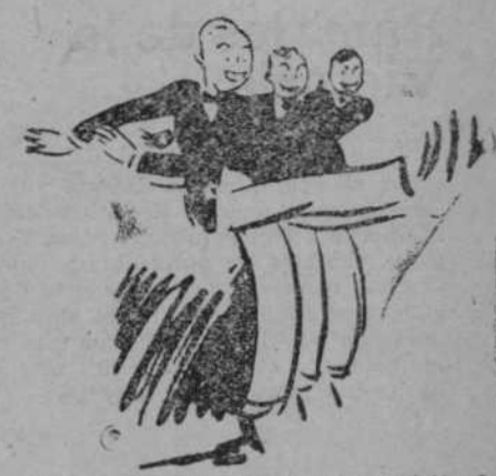
Actitud que, por lo menos espiritualmente, adoptan los "hinchas" cuando la línea delantera de su equipo predilecto se acerca a la portería contraria.