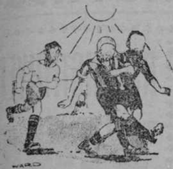
Frase gráfica que han puesto de moda algunos jugadores: "Al sol que más calienta."