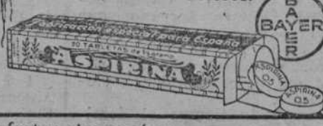
—No afectan al corazón—

Pero, ¿qué representan para nosotros estas bellezas cuando una dolencia nos impide disfrutar de este goce? Los resfriados, reumatismo, gripe, influenza y otros dolores nos echan a perder el buen humor. Evitemos estos molestos contratiempos tomando a tiempo el único producto que tiene tan hermoso lema: „Libre de dolores.“