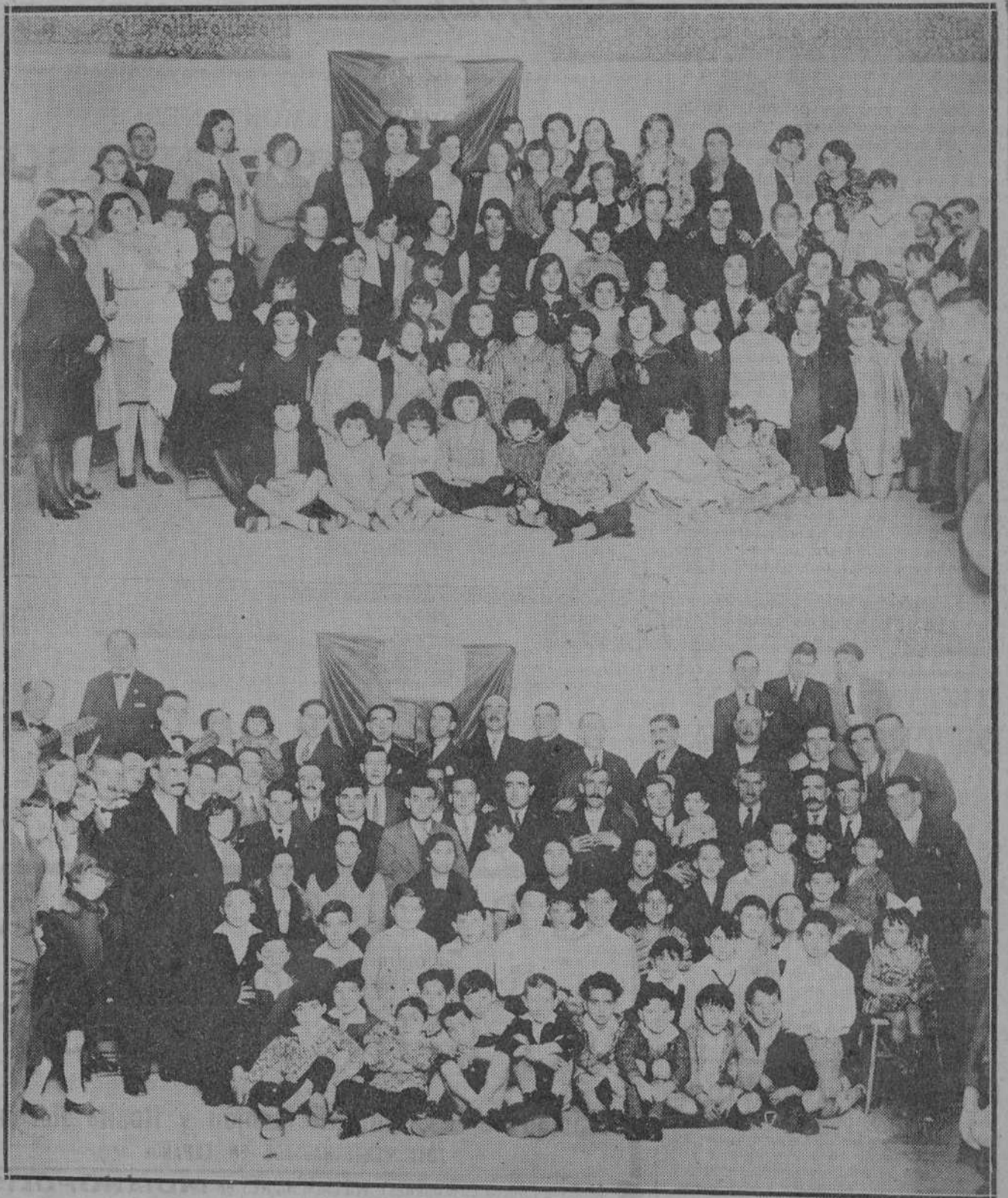
Grupos de familiares a la brillante fiesta inaugural de la Casa Vallisoletana en Santander.