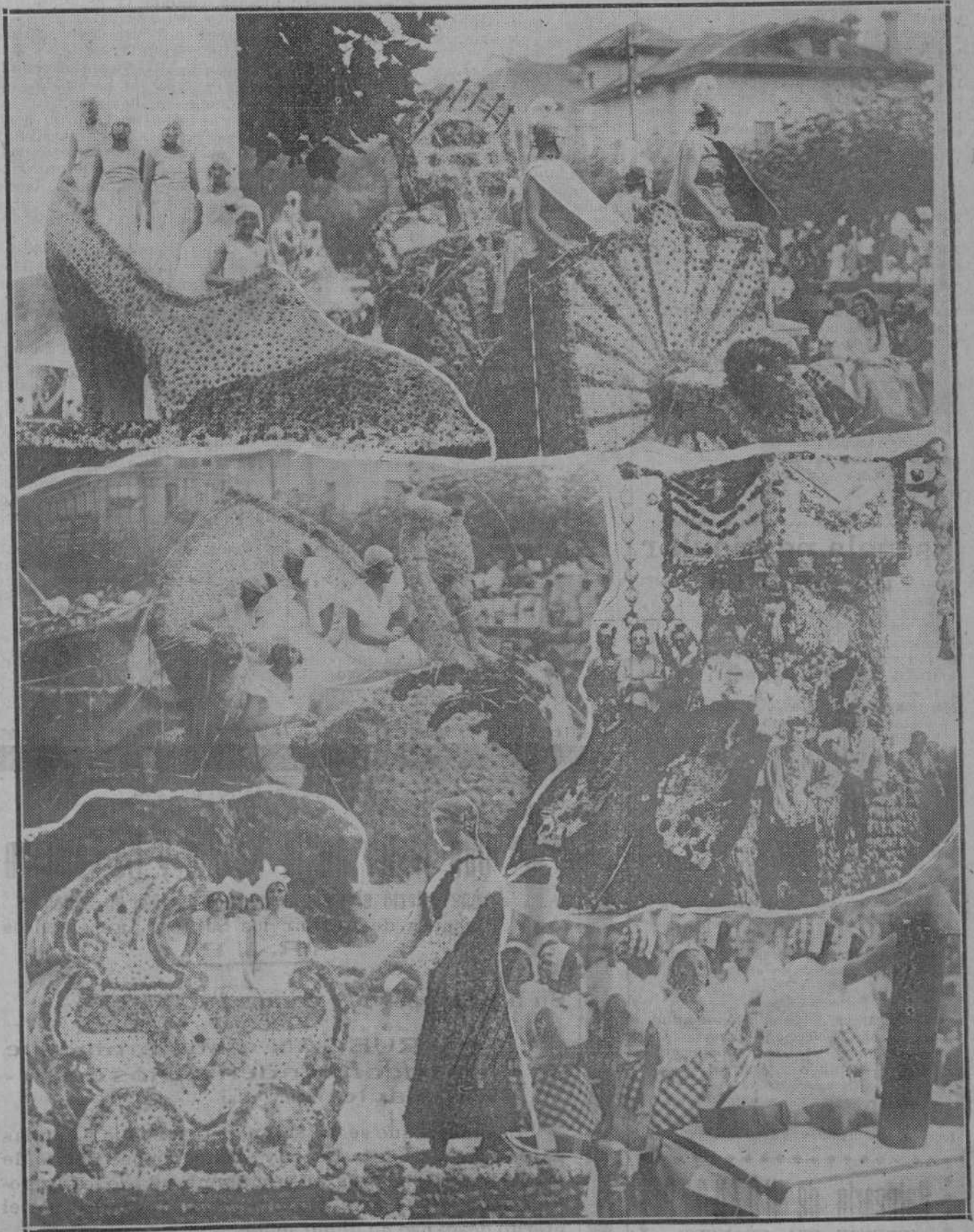
DE LA BATALLA DE FLORES DE LAREDO.—Completamos hoy con las presentes notas la copiosa información gráfica obtenida por nuestro compañero Alejandro en Laredo con motivo de su brillantísima y popular batalla de flores

han visto estas infelices mujeres y estos pobres hombres que vienen a nutrir la miseria y las lepras de las urbes. Es sublime la estampa del labrador en la tierra señera exornada de caminitos paralelos y morenos. En estas despedidas, en estas deserciones, en estas vanidades, esa estampa, antes sublime, se convierte en una fea vulgaridad que no acertamos a describir. El labrador en la mies, entre el lombillo de heno, bajo la campana del hogar, en hora dulce de sosiego, nos atrae y nos hace pensar en cosas muy bellas y hacendosas que no