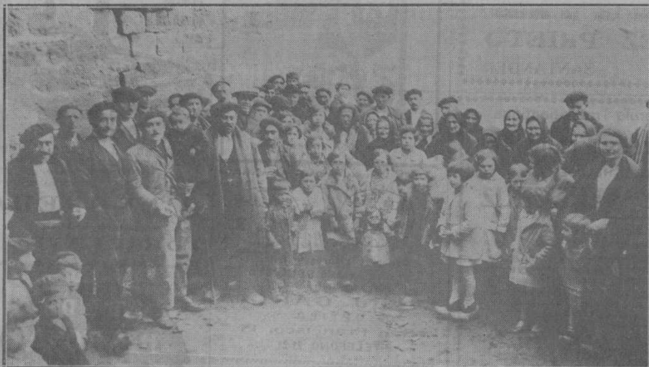
Grupo de vecinos de Medianedo rodeando al redactor enviado de LA VOZ DE CANTABRIA en la visita informativa que éste hizo a los pueblos que han de desaparecer en el pantano.