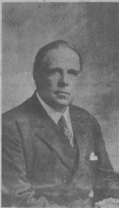
El ilustre escritor don Eugenio D'Ors, que anoche dió en el Ateneo una interesante conferencia.

Eugenio D'Ors es presentado por el presidente de la Sección de Literatura, don Víctor de la Serna, que termina diciendo: «Ante vosotros se des-