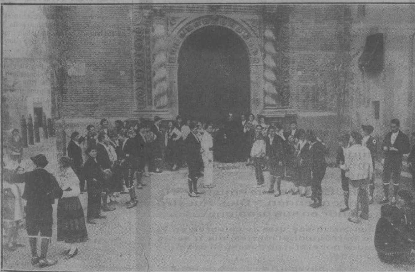
ESCENAS DE ALDEA.—A misa mayor.

ROGAMOS A CUANTOS TENGAN QUE DIRIGIRSE A ESTE PERIODICO, QUE MENCIONEN NUESTRO APARTADO DE CORREOS, NUMERO 62. EL NO HACERLO, PUEDE EXPERIMENTAR ALGUN RETRASO LA RECEPCION DE LA CORRESPONDENCIA.