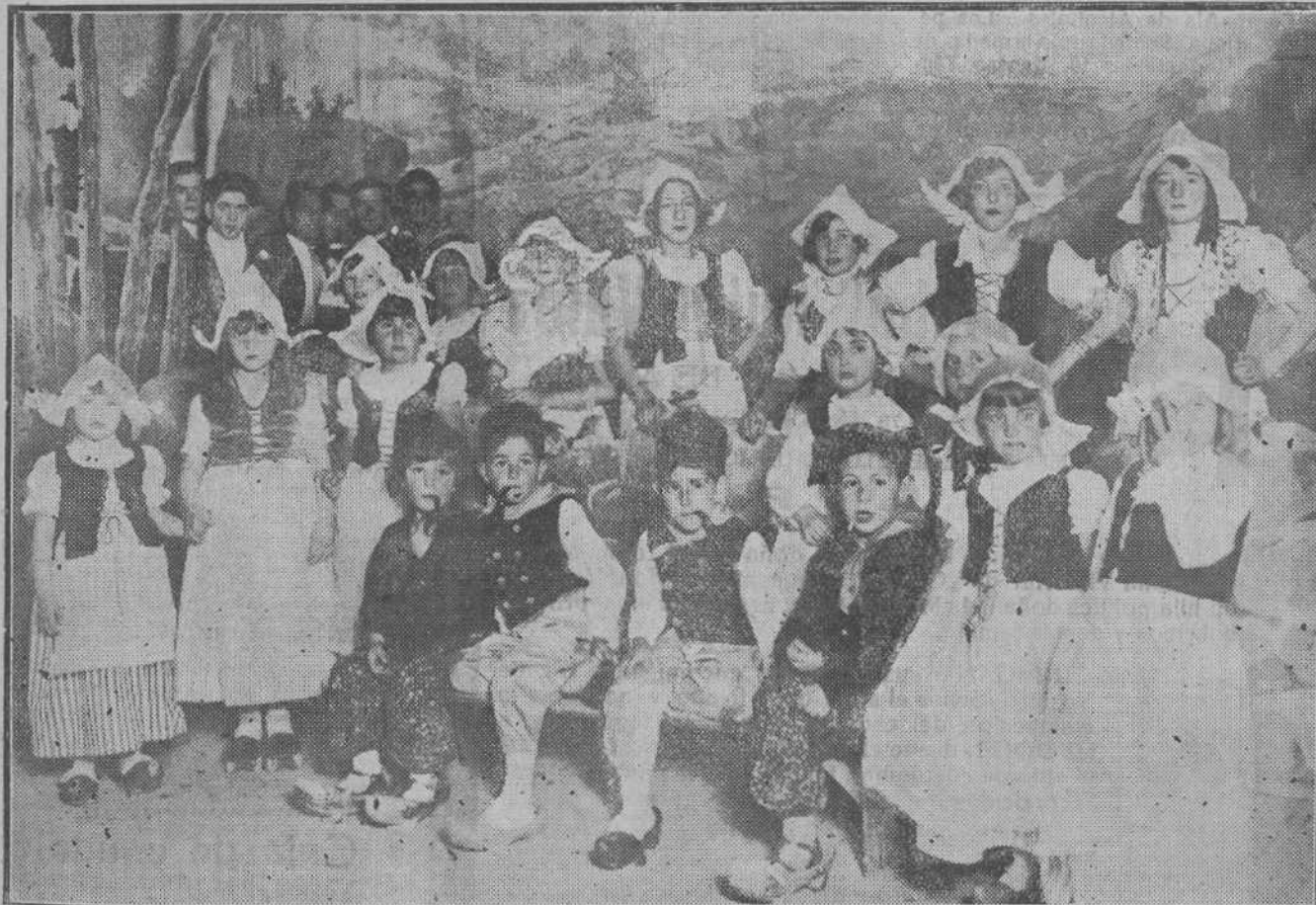
EL DOMINGO, EN EL TEATRO PEREDA.—Encantadores pequeños artistas que tomaron parte en la velada organizada por la Asociación de señoras para el mejoramiento moral y material de la clase obrera.

Mañana, Dios mediante, publicaremos el beneficio obtenido en estos festivales.