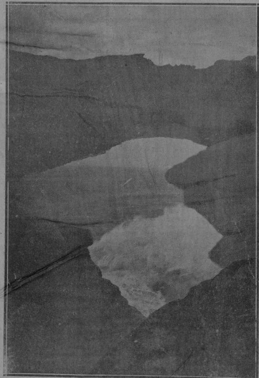
La belleza del mar y las rocas. En Cabo Menor, la costa brava ofrece paisajes de mar y rocas tan sugestivos como el que reproduce la bella fotografía de Alejandro. El mar, al remansarse entre las peñas, da la sensación de un lago suizo. Pero, junto a esta serenidad impresionante, rompen las olas y el mar pone la violencia de sus espumas en el cuadro. La belleza de Cabo Menor es todavía una belleza inédita para la mayoría de los montañeses. Hacerla asequible por medio de comunicaciones cómodas, ha de ser el ideal de nuestro pueblo.

Quizá a algún espíritu fuerte se le antoje cursi y sensiblera nuestra crónica. Pero es que la vida está llena de episodios cursis y sensibleros. Cursi y sensiblero es el dolor de los infelices que no llevan aureola de héroes o de elegidos. Y, además, de todos estos episodios se deduce alguna moraleja provechosa. En este caso, es la afirmación de nuestra esperanza en una organización social más justa que borre las tristezas inevitables del asilo. Un régimen de pensiones a los inválidos del trabajo, para que el hogar no se deshaga nunca y los esposos ancianos puedan morir sin separarse, como sin separarse vivieron desde que el amor les unió.