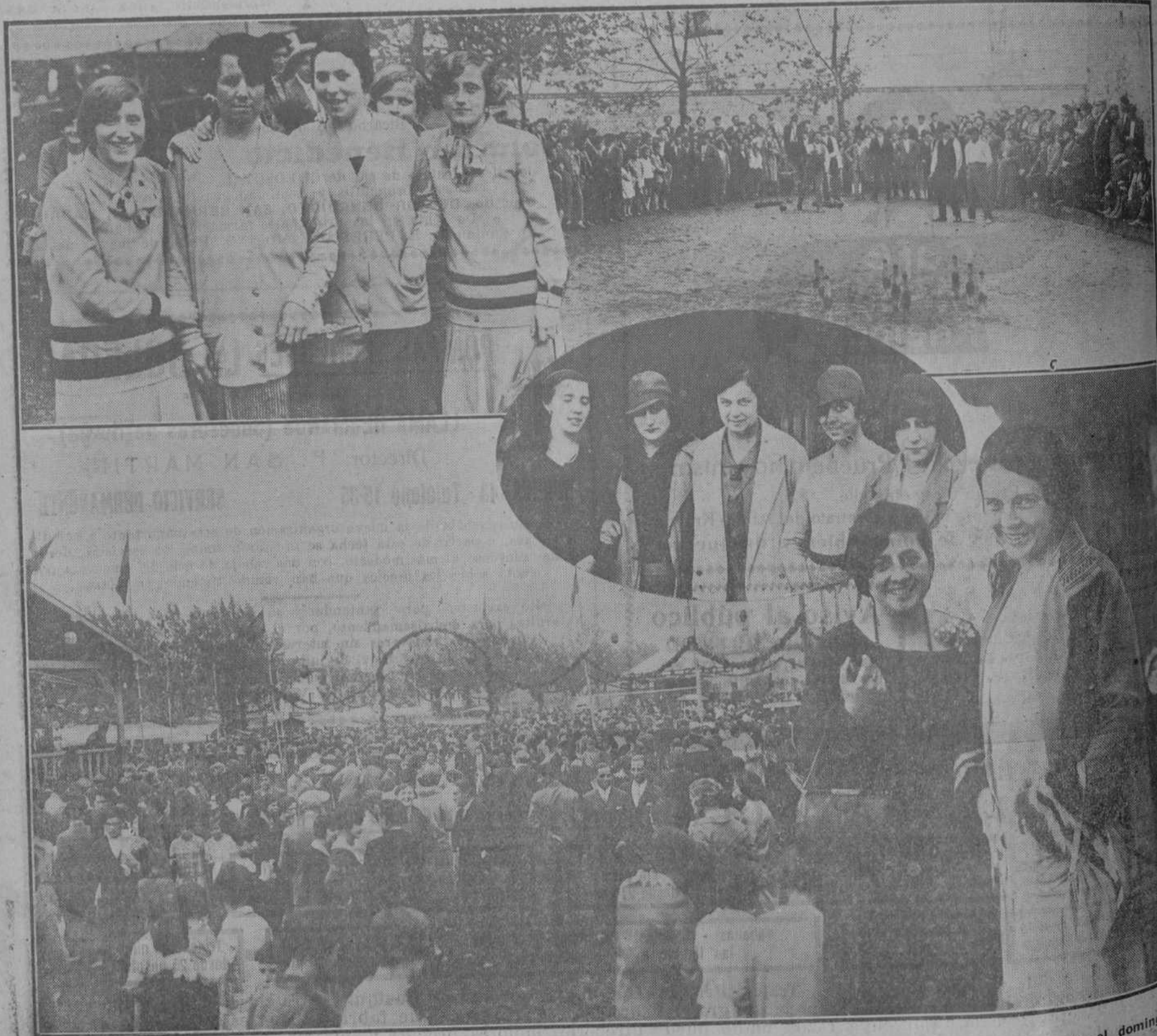
LAS FIESTAS DE SANTA MARIA,

Se convoca a todos los inscriptos y simpatizantes de dicha Sección a las ocho de la tarde de hoy, en el domicilio social.