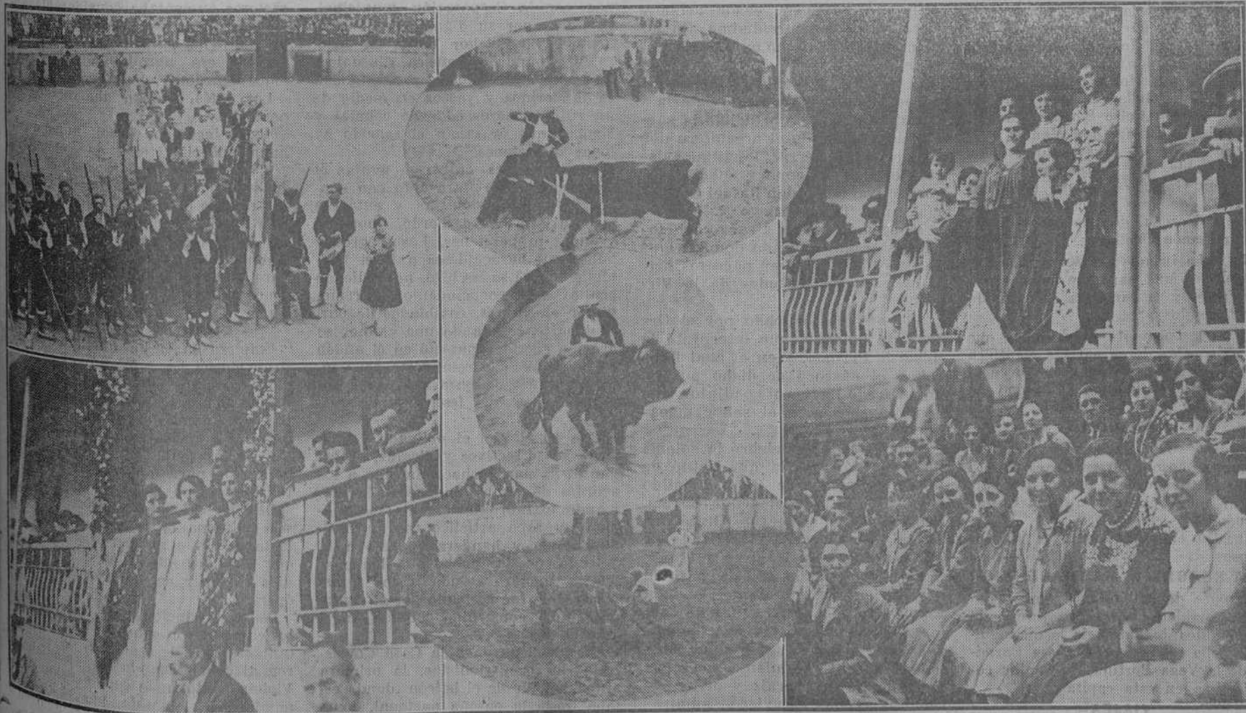
EN LA PLAZA DE AMPUERO.—Violeta Carral "echando" un cantar.—El palco de las presidentas.—Tres monumentales momentos de la lidia.—¡Eche usted caras bonitas en el palco y en el tendido!... (Fotos Leoncio).