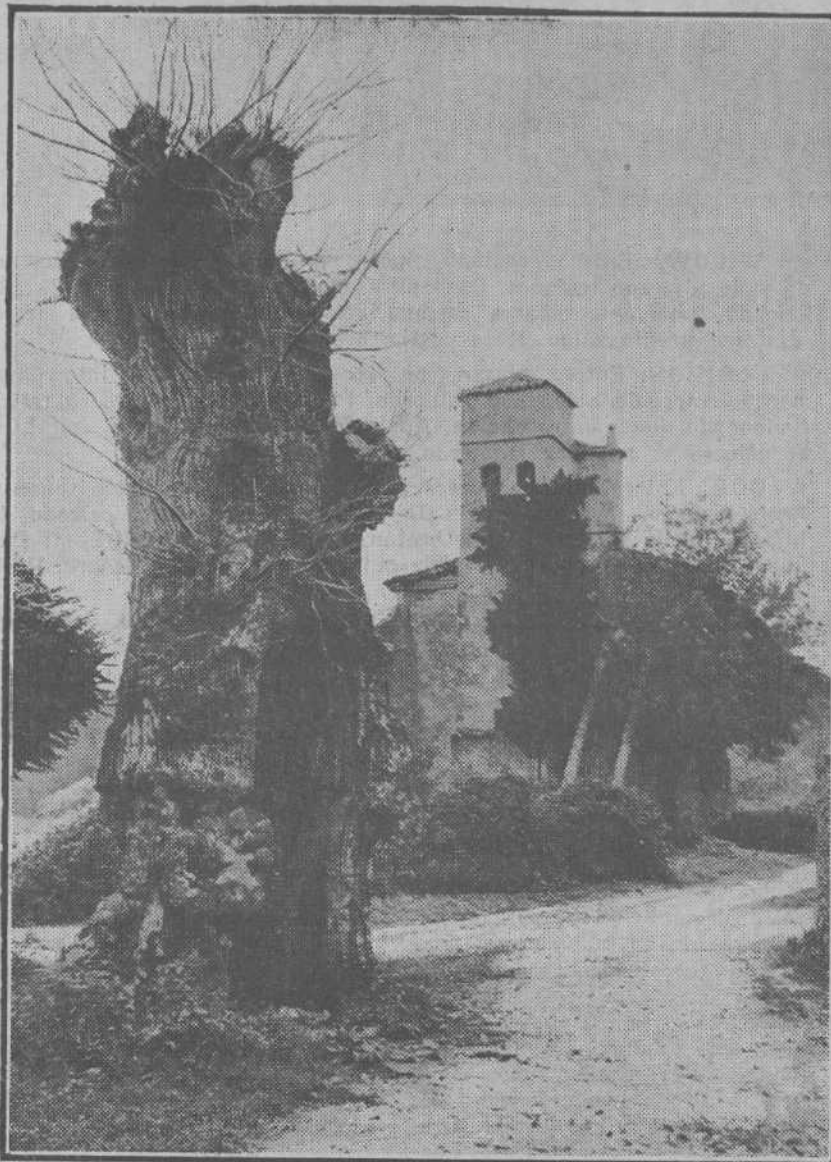
LA MONTAÑA PINTORESCA.—Un bello rincón de Barcenaciones.

Observe cómo atrae su atención nuestra publicidad económica. Igualmente atrae la de los demás lectores.