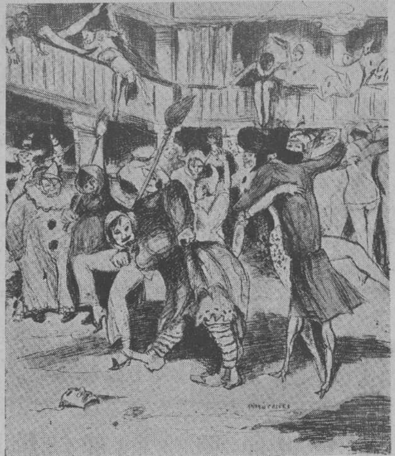
¡Y aquellos bailes, llenos de máscaras, donde había hasta quien bailaba!