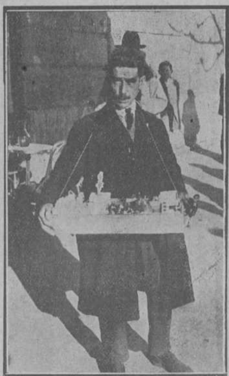
... ir con la ropa repasada y limpia. (Foto Alejandro).

Ya sabe usted como empecé a vivir en esta tierra, que ya juzgo mía y a la que adoro de todo corazón porque me criado en ella a