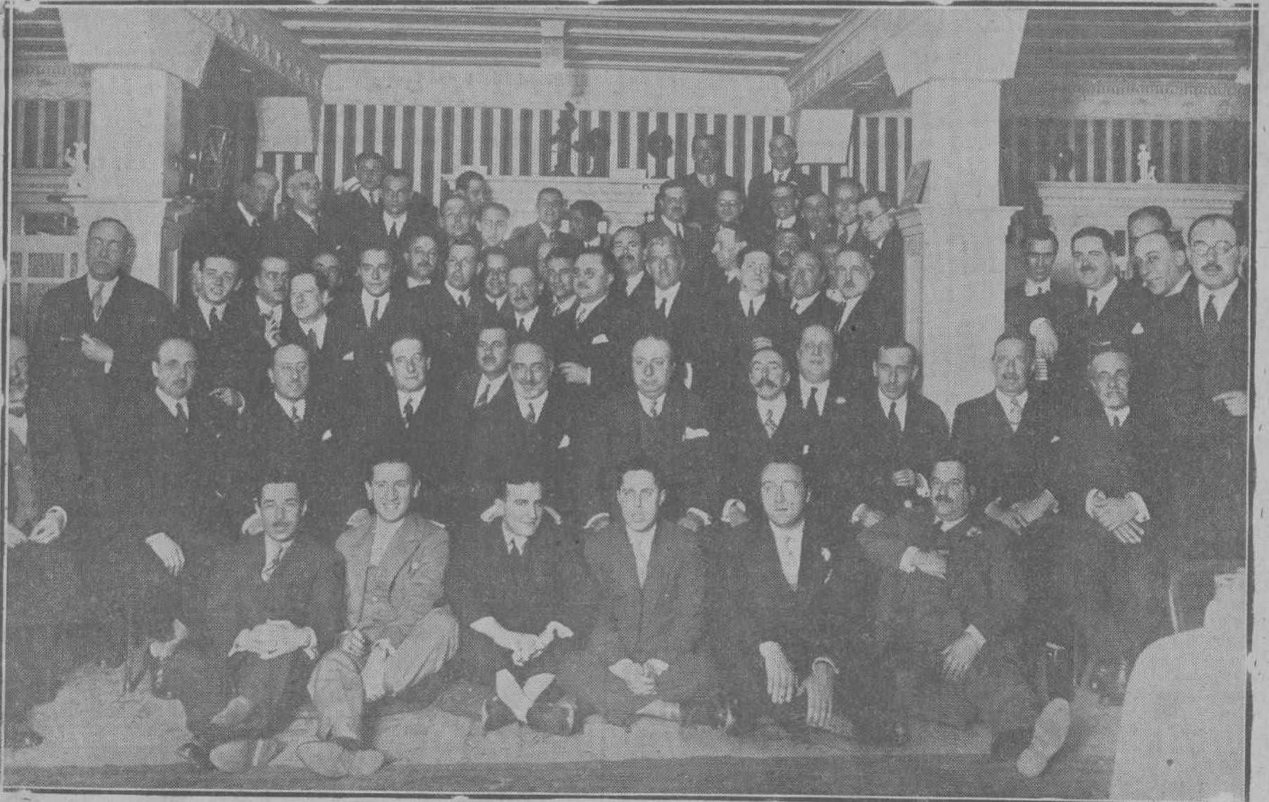
Los ingenieros de las cuatro especialidades, con ejercicio en Santander y su provincia, reunidos ayer en un banquete en el restaurant Royalty.

—El chófer del príncipe Sifka, enamorado locamente de la esposa de éste, y no siendo correspondido, despenó el auto en que ambos viajaban matándose e hiriendo gravemente al matrimonio.