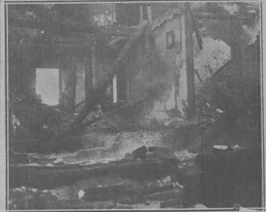
DEL INCENDIO DE LA MADRUGADA DE AYER EN PEÑACASTILLO.— Estado en que quedó la parte interior de la casa quemada.

El estimado colega propone la constitución de un Comité central que unifique la dirección y las iniciativas. Estas iniciativas deben encamarse en el sentido que ahí se indica. Es inútil ofrecer al visitante espectáculos de grande o pequeña ventaja que le diviertan una hora, si ha de sentir en las horas restantes la ausencia del agrado y la presencia de cierto molesto celo esquilmador. Cuando tal sucede, el veraneante o el turista se resigna por aquella vez, como ante un fastidio que no le es dado evitar, mas al tomar su billete de