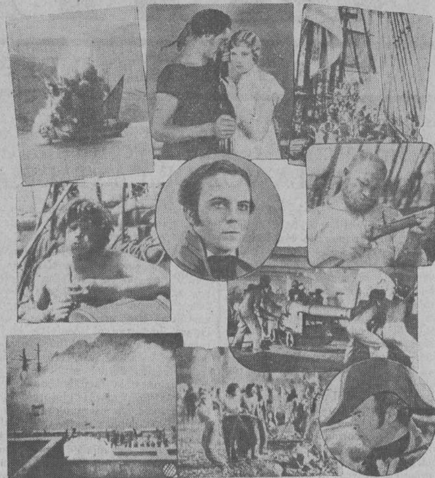
He aquí varios momentos de la magnífica producción cinematográfica "Típoli", pasada recientemente con gran éxito en el Gran Cinema.

ser la única cinta en que se ha permitido impresionar el templo metropolitano del Pilar, desarrollándose la escena del juramento ante la propia Pilarica.