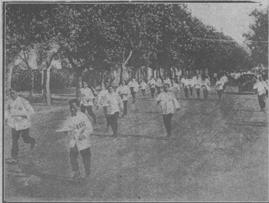
Un momento de la curiosa y tradicional carrera de camareros de café que se celebra todos los años en Roma. Como puede verse, si no acuden pronto a las llamadas de los parroquianos, no será por falta de entrenamiento.

Ya era hora de que los industriales queseros de la provincia se vieran reunidos para defender sus intereses y los de los ganaderos que hoy se ven tan seriamente amenazados. No cabe duda de que por la unión podrán lograr lo que aisladamente les hubiese sido difícil conseguir.