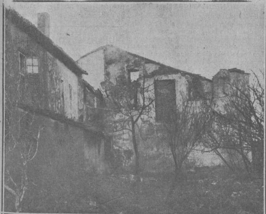
DEL INCENDIO DE LA MADRUGADA DE AYER EN PEÑACASTILLO.— Parte posterior de la casa destruída por las llamas, a la que están unidas otras dos, como puede apreciarse en la fotografía, y que se salvaron merced a la intervención de los bomberos.

Un anuncio es tanto más visible y eficaz cuanto menor es la plana del periódico donde se inserta.