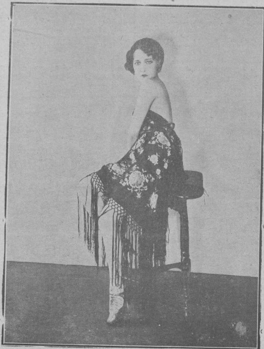
Una bellísima artista de cinematógrafo posando ante un fotógrafo atrevido. (Nos lo suponemos por la cara de susto que tiene tan monísima criatura.)

Dos la carta filial, que así decía: «Uno que tres en abundancia os [deseo y gozad en la todo de venturas mientras yo sufro aquí, pues no [os veo.»