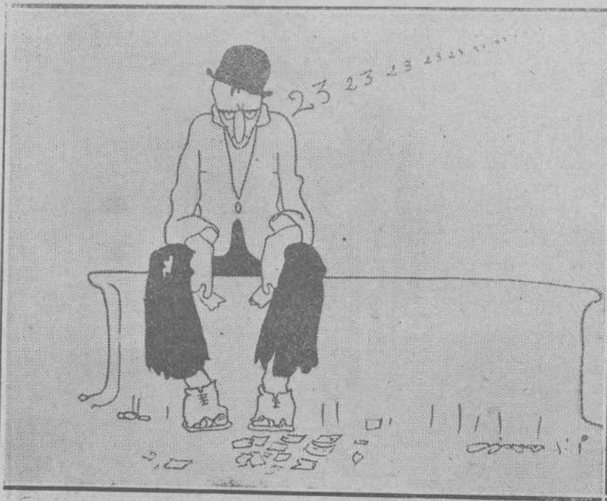
El decepcionado.—Las ilusiones perdidas, participaciones rotas, al pie del banco esparcidas se rien de las heridas del pantalón y las botas.