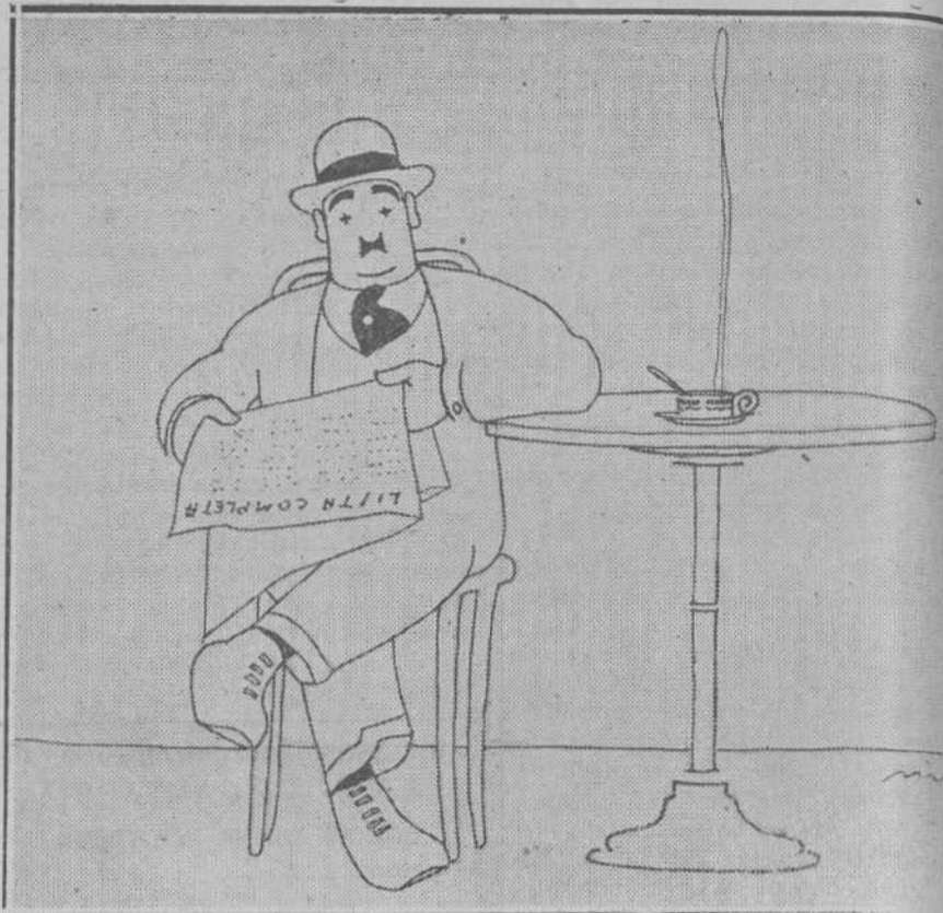
—¡Hombre, que lástima! Por cinco mil cuatrocientos doce números no me ha tocado el reintegro.

Yo, por no ser menos, la dije: Pero, ¿ha sido el gordo? No—me contestó— el otro, el que va delante. ¡Ah!, ¿ese diez y siete mil?