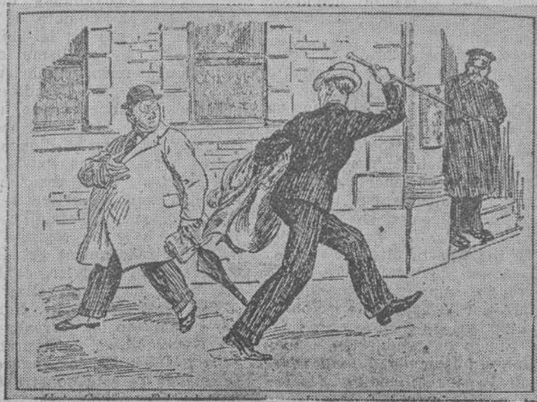
EL HOMBRE MODERNO.—¡Hola, Gutiérrez! Deben de haber pasado ya diez años desde la última vez que te ví. ¿Cómo te va? Perdona, chico, no puedo detenerme. Espero encontrarte tan saludable dentro de otros diez años. ¡Adiós!

Prof. Warsaw (De la Universidad de Missouri).