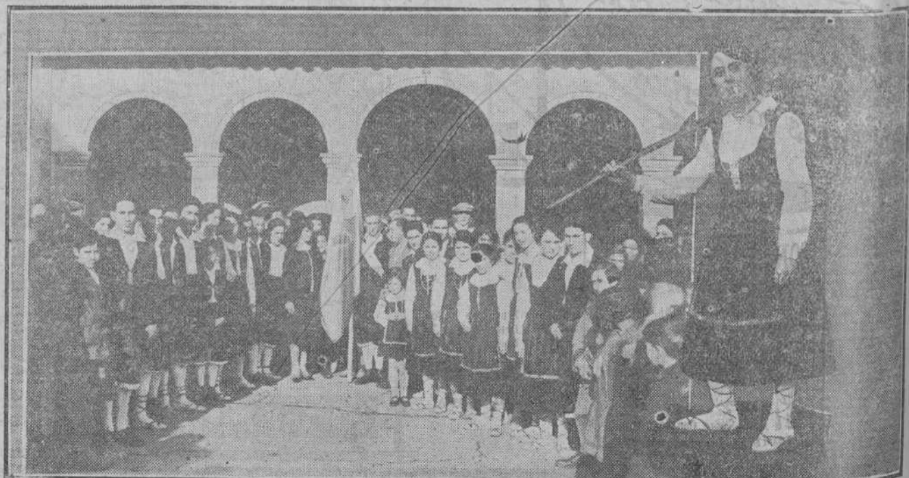
El notable orfeón "La Victoria", de Famales, con su presidenta, en un momento de la fiesta organizada para la entrega y bendición de la bandera de la entidad.—En el ángulo, la bella señorita contratista del orfeón.