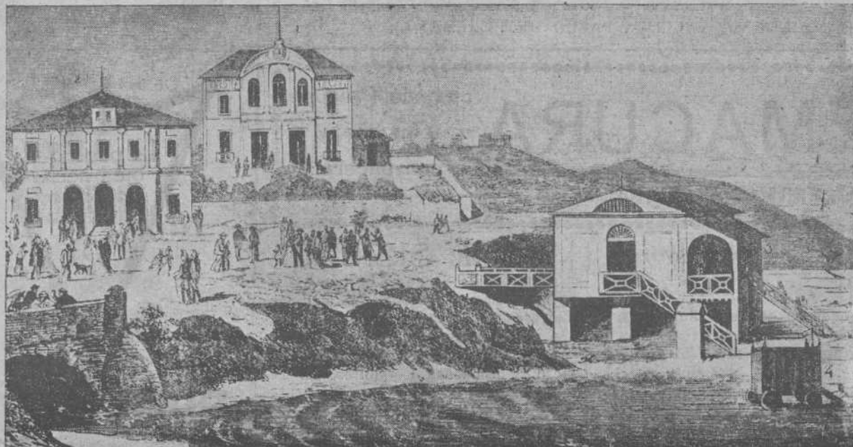
Un curioso grabado del Sardinero en 1872. La primera galería de baños y los primeros edificios de la famosa playa.

Ni uno ni otro, ni el periodista ni el gran negociante, han tenido la suerte de que sus nombres sean recordados en la rotulación de los paseos y calles del pintoresco barrio, ni de ningún otro modo perdurable. Saldar esta deuda de justicia es un deber que incumbe a la Real Sociedad Amigos del Sardinero, que no es más que la heredera de sus amores y entusiasmos.