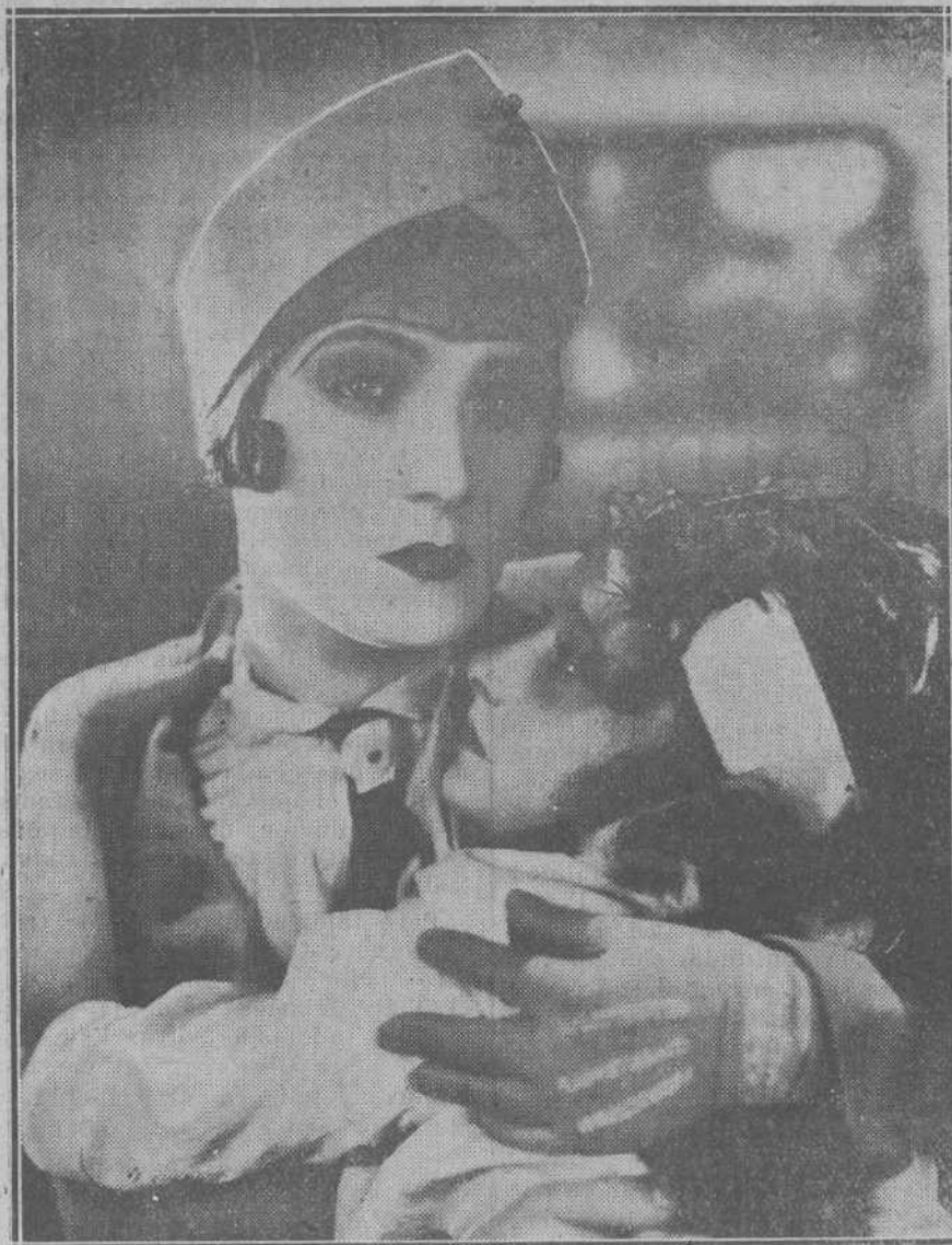
Paulina Starke consolando a la pequeña Nancy Prince, en una escena de las últimas producciones de esta estrella americana.

Para los estrenos de estas tres proyecciones, que se verificarán el lunes, el miércoles y el viernes, abre la empresa un abono a butaca a razón de 3,25 las delanteras y cuatro pesetas las preferentes, y otro de palcos, a 21 pesetas.