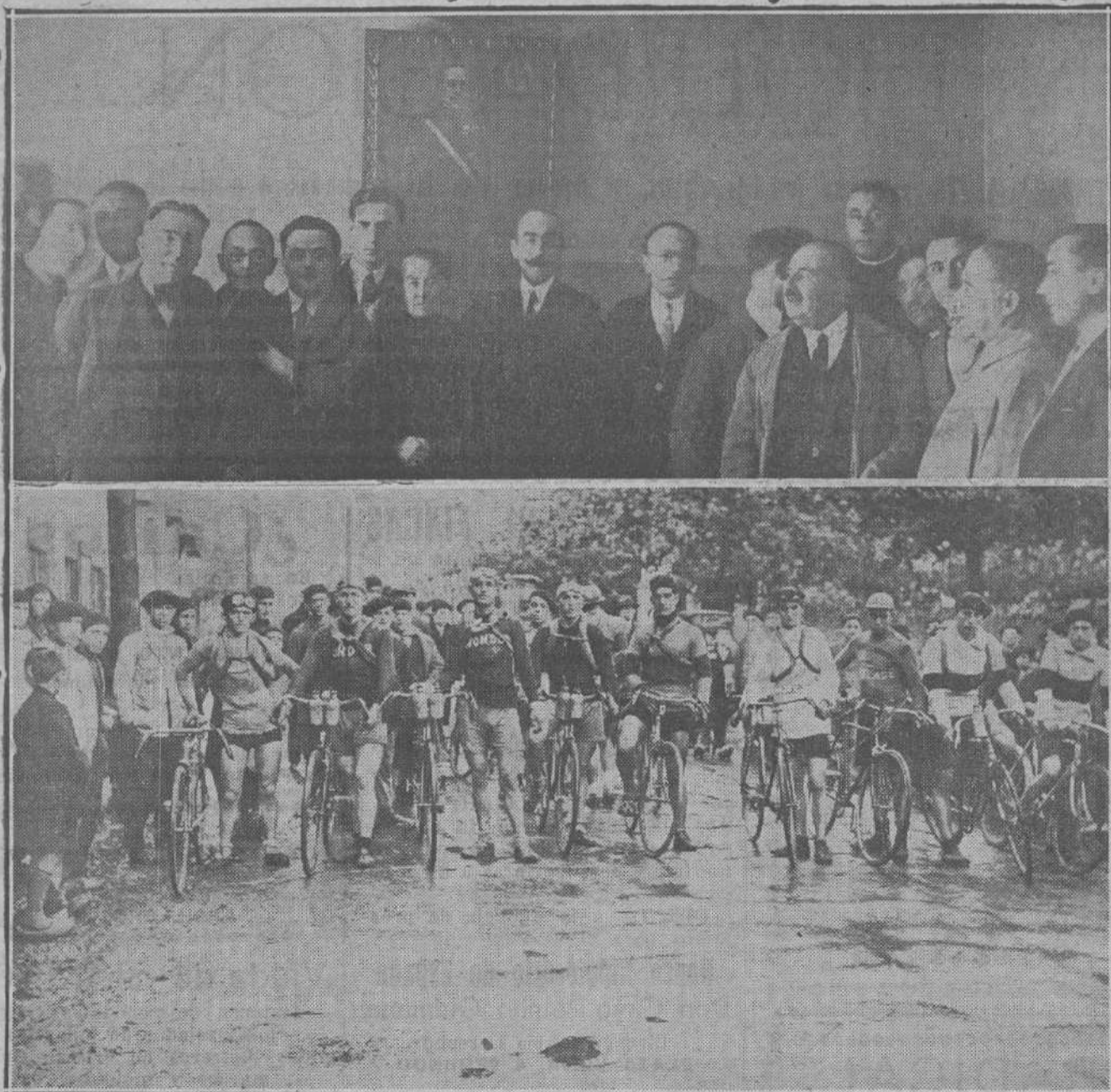
NOTAS GRAFICAS DE TORRELAVEGA.—La presidencia en el simpático acto de inauguración de la Biblioteca Popular.—Los corredores que tomaron parte en la prueba ciclista verificada el domingo, dispuestos para la salida.

Esperemos que el nuevo prelado, no designado aun, recoja el proyecto de su antecesor, proyecto que tan admirablemente encaja en las funciones de su apostolado y cuya realización merecería la gratitud de Santander.