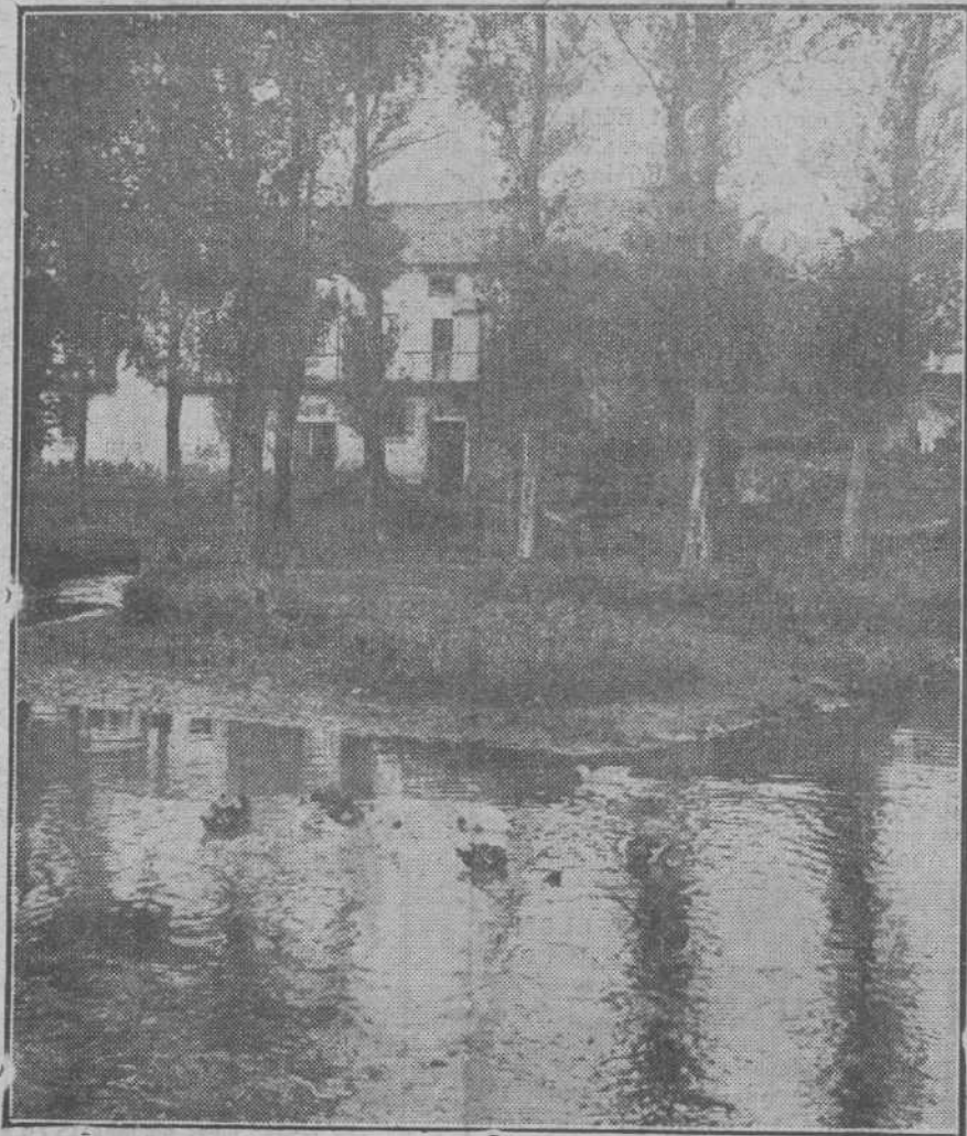
PAISAJES MONTAÑESES.—El encantador lugar de Las Fuentes, en Reinos.

A lo mejor el acusador es algún radioescucha que no da con la onda.